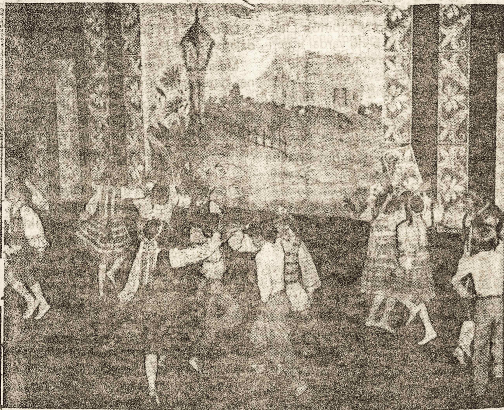
Smagiai sukasi Toronto "Gintaro" jaunučių poros, besiruošdamos tautinių šokių šventei