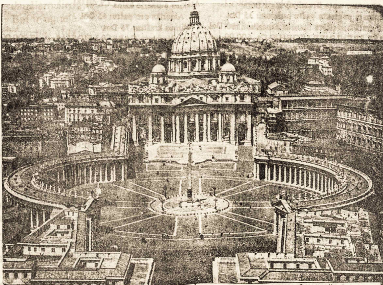
Šv. Petro bazilika Romoje. Čia birželio 29 Popiežius uždės kardinolo beretę ir Lietuvos kardinolui.