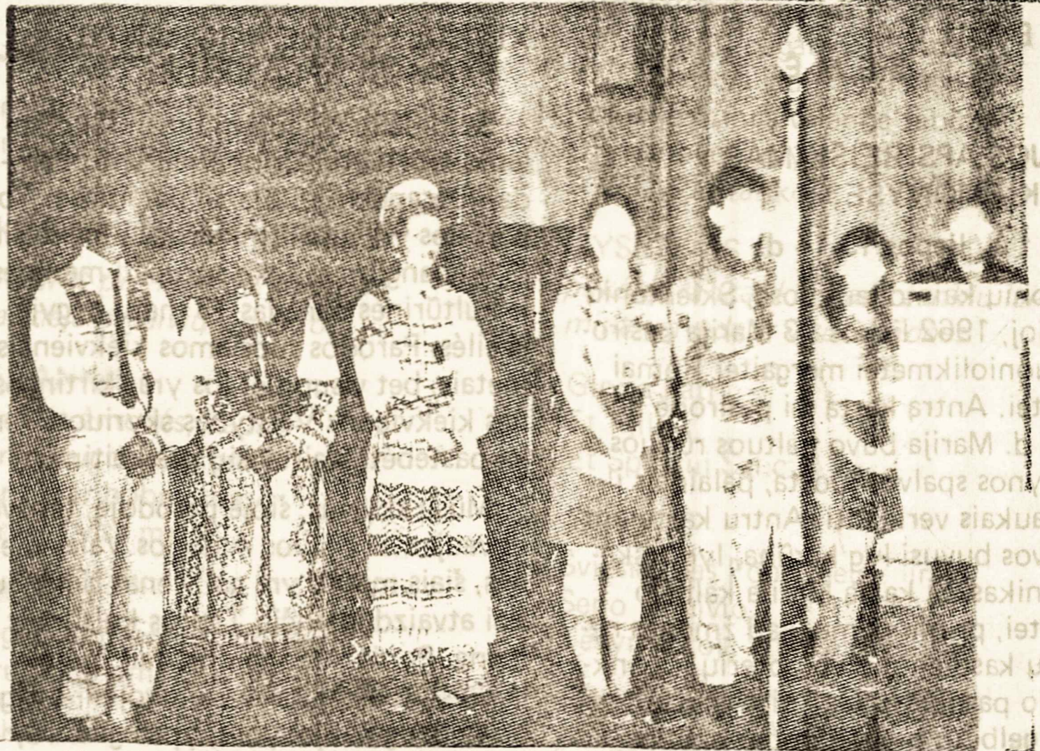
Lietuvių jaunimas São Paulo katedroj Gedulingojo Birželio pamaldų metu.

Birželio 14 d. demonstracija praėjo be pastebimo smurto, be namų areštų. Gedimino aikštė buvo apsupta milicininkų ir draugovininkų, bet jie elgėsi žmoniškiau, šypsojosi, klausydami labai aštrių kalbų, kokių jie nepratę girdėti. Daugelis žmonių bijojo veržtis