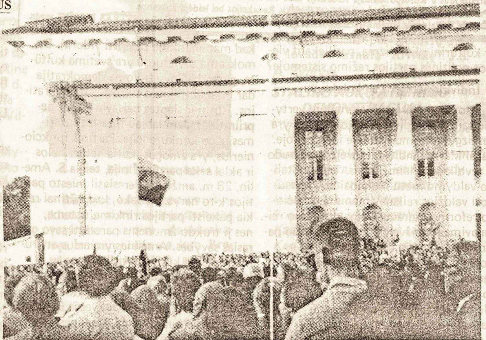
Demonstracijose prie Vilniaus Katedros plevesuoja trispalvė, laukianti valdžios pažadėto oficialaus pripažinimo

Ligačiovas nuo 1985 metų tapo antrasis po Gorbačiovo Kremliaus hierarchijoje. Galvojama, kad jo paskyrimu buvo norima prilaikyti Gorbačiova. Tačiau ir Ligačiovas remia "perestroiką". Jis net remia naujus pasikeitimus užsienio politikoje – pasitraukimą iš Afganistano, bet aiškiai neremia Gorbačiovo politinio persitvarkymo aspekto "glasnost", demokratizacijos ir per didelės (jo galvoji-