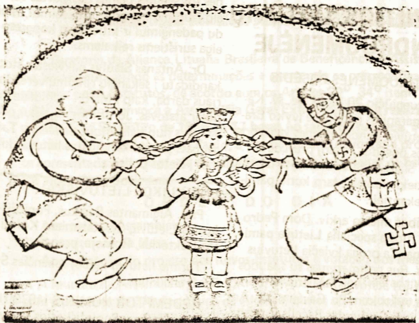
Taip tapėsi Stalinas su Hitleriu dėl Lietuvos, kol pagaliau ją pasiglemžė Stalinas.

Alpių politika labiau vyliojo vokiečius. Ten, pro Alpes, Karpatus, Balkanus ėjo kelias į Viduržemio jūrą ir į Afriką, bet tas kelias buvo ilgas. Kad sutrumpinti kelią politikai pasimatė, kad galima padaryti jungiant Reicho vokiškas žemes ir pirmoji auka buvo Austrija. Mažai tai palengvino ir grėsi pavojus iš Prancūzijos ir iš Čekoslovakijos, tada vokiečiai iš Čekoslovakijos atėmė Sudetų kraštą ir taip kelias į Balkanus liko laisvas. Bet štai sukruoto Anglijos ir Prancūzijos politikai ir pakely sudarė užtvartą, kurios centre pastatė Rumuniją ir Turkiją.