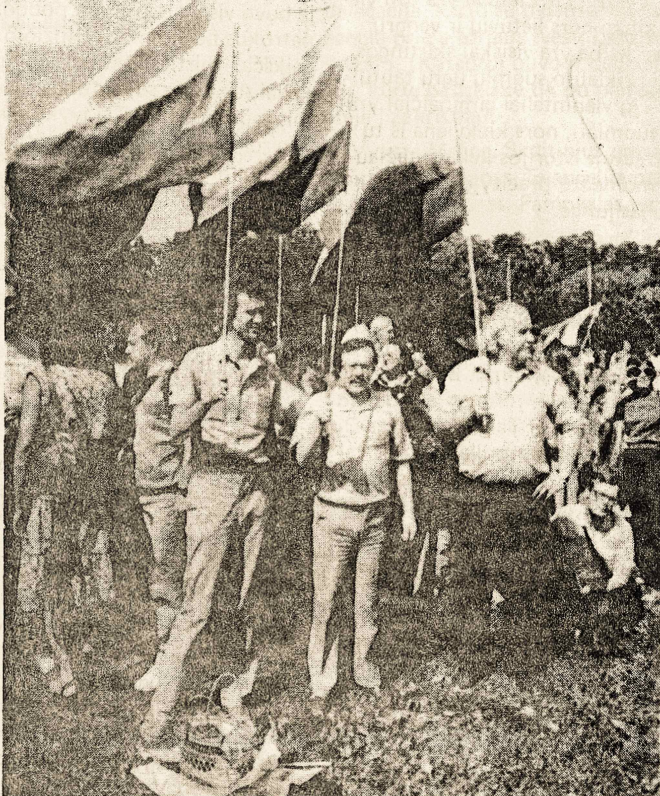
Didingai plevesuoja trispalvės vėliavos Lietuvos persitvarkymo sąjūdžio liepos 9 d. surengtoje demonstracijoje Vilniaus Vingio parke

Nuo pat valdžios perėmimo Gorbačiovas labai šiltai atsiliepia apie Vakarų Europos valstybes. Tai nenuostabu, nes jam labai reikia Europos pagalbos savo ekonominiams reformoms įgyvendinti. Neseniai išleistoje knygoje jis Europą vadina kaip visų bendra tėvynę ir siūlo užbaigti Europos pasidalinimo kiverčius. Gorbačioviui reikia Europos paramos dar ir dėl to, kad JAV labai riboja paskolą Rusijai. Didesnės finansinės paramos jis tegali laukti iš Europos ir Japonijos. Šalia finansų iš kitur. Gorbačiovas turi sumažinti išlaidas gynyboje ir tas sutaupas pervesti į ekonomijos pagerinimą. Atominių ginklų sumažinimas nedaug išlaidų tesutaupė, nes didžiausios išlaidos yra konvencinėje ginklų srityje. Tikrai žymus konvencinių pajėgų sumažinimas galėtų padidinti biu-