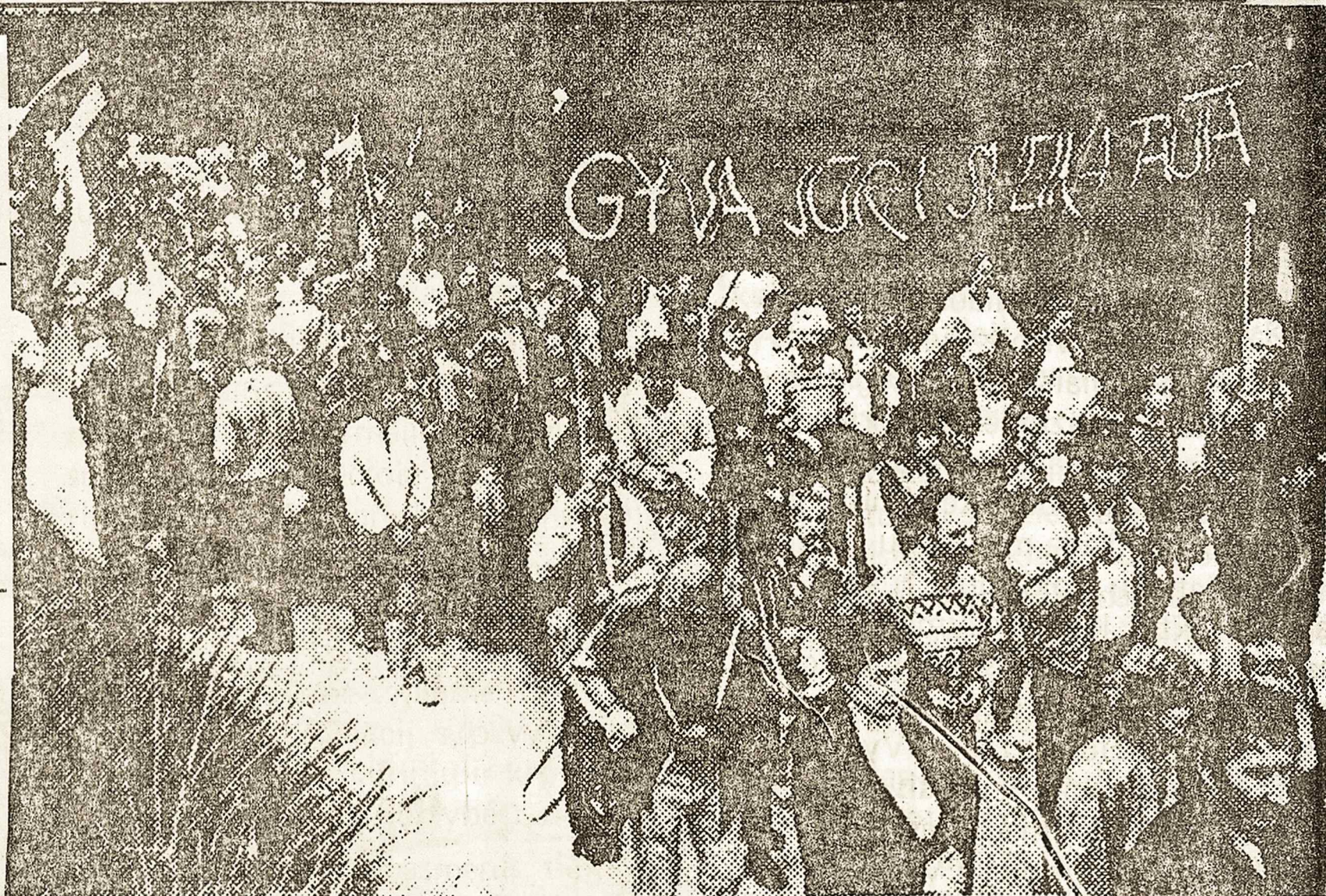
Lietuviai rugsėjo 3 d. reikalauja pagalbos užterštai Baltijai. Jų nuotaikos atskleidžia pajūryje žygiuojanti minia su Lietuvos vėliavomis ir prasmingu plakatu "Gyva jūra – sveika tauta"

Ignalina yra antroji jaudinanti tema, kurią kelia sąjūdis ir tuo veikiausiai savo pusėn patraukia lietuvių daugumą, rašo Vienos dienraštis. O ir kiti sąjūdžio reikalavimai dėl didesnio ūkinio savarankumo bei gimtosios kalbos teisių verčia partijos vadovus veikti, bent iš dalies pa-