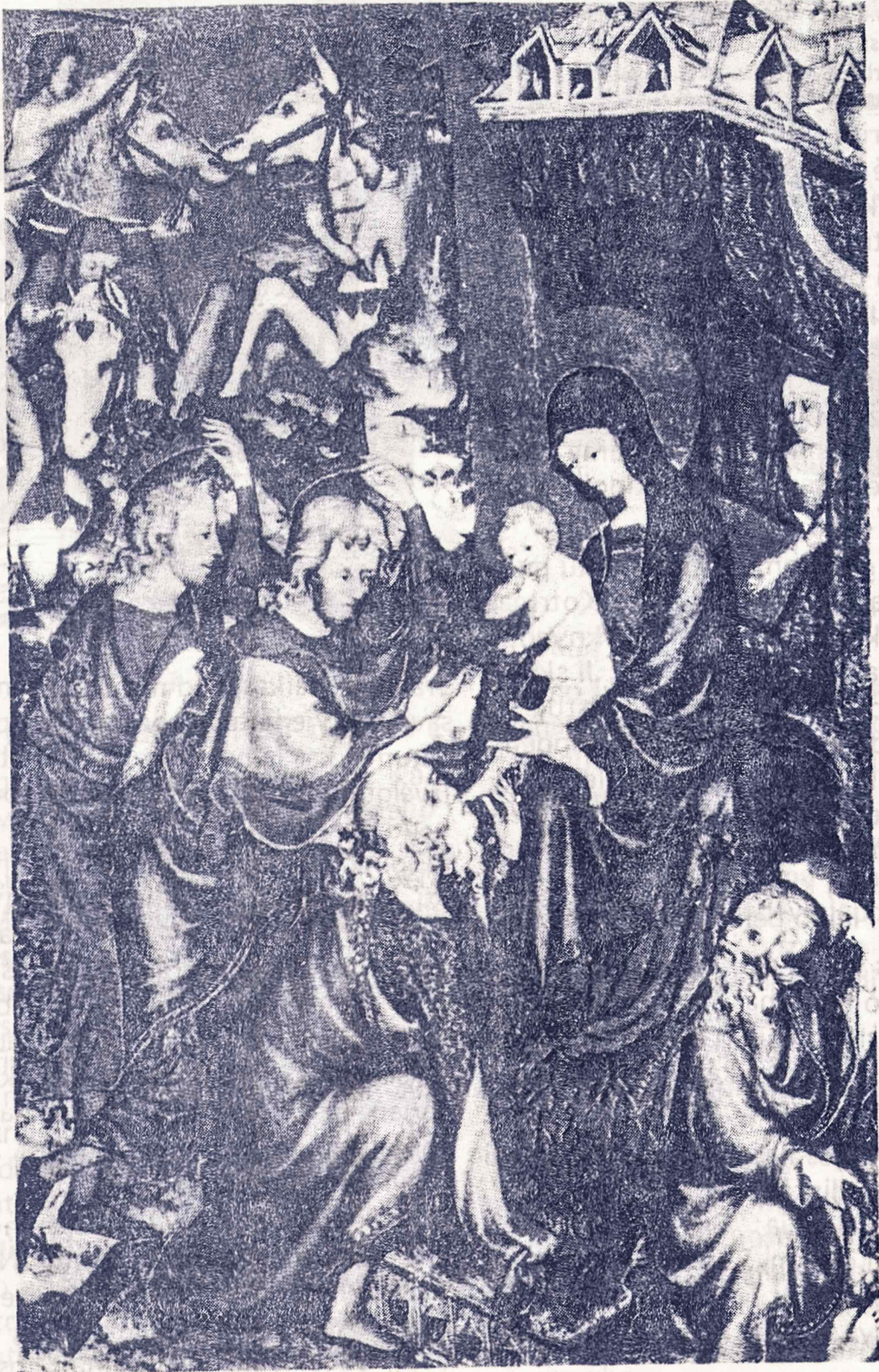
GIMĖ MUMS IŠGANYTOJAS – EIKIME JO PAGARBINTI

Kartais tik po kieto ir siaubingo gyve-nimo patyrimo išeinama iš tų klystkelių. Tai gerai pavaizduoja Vladimiras Maksi-movas. Jis gimęs Leningrade apie 1932 m. Jau revoliucijos atmosferoje augęs ir brendęs, tačiau įžvelgęs jos beprasmingu-mą ir už savo atvirą žodį tris kartus pa-skirtas į psichiatrinę ligoninę. Pagaliau išstremtas iš Sovietų Sąjungos, buvo vie-nas iš pagrindinių žurnalo "Kontinent" kūrėjų. Jis yra parašęs romaną "Karanti-nas", kuriame skatina siekti dvasios stip-rybės, sekant Evangelija. Viename inter-view Maksimovas pasakė: "Be dvasinių vertybių pažinimo, be žmogaus sugrįži-mo į save nėra kitų ribų, kurios suvaldy-tų jame esantį žvėrį".