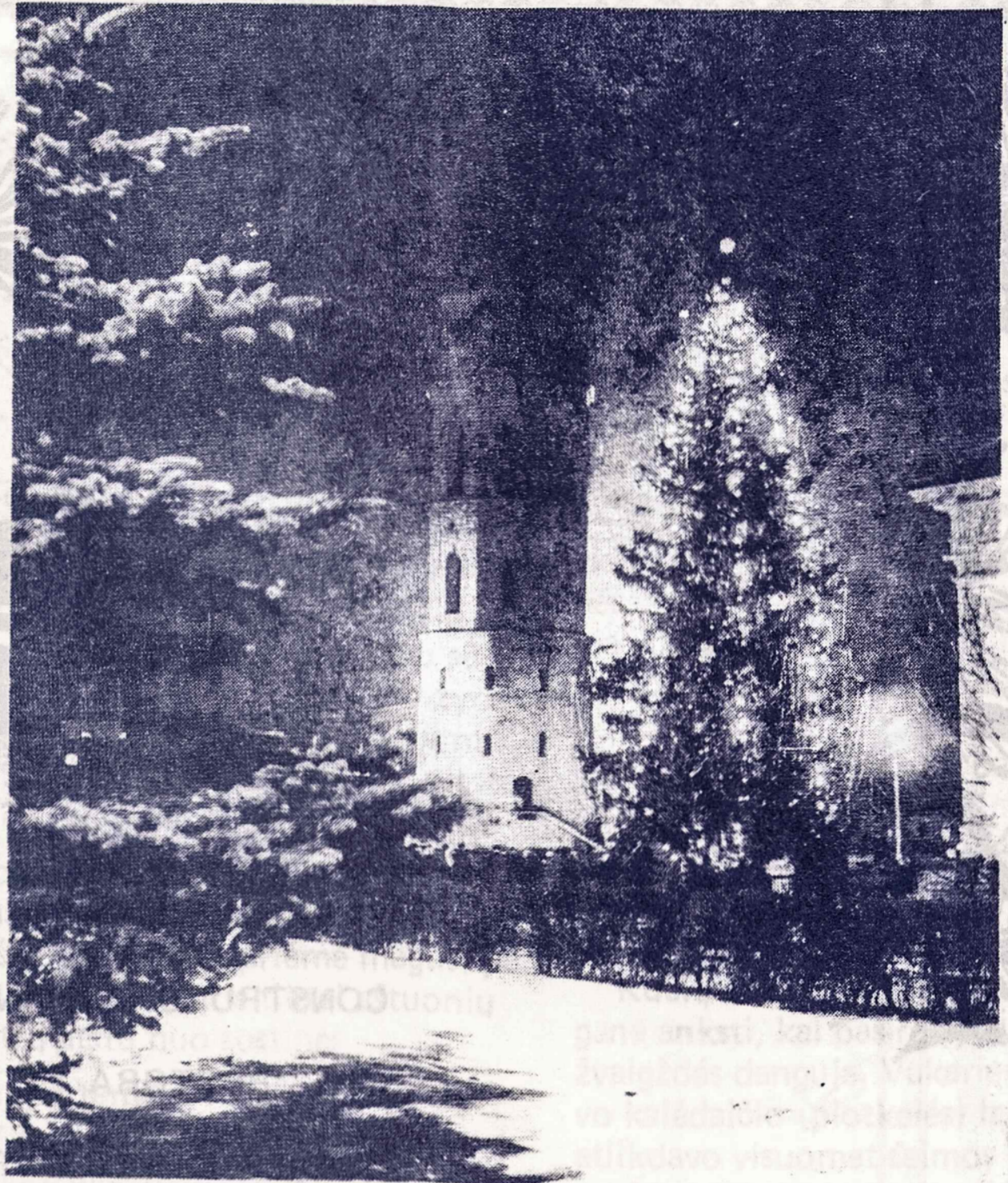
Eglutė prie Vilniaus katedros bokšto

PARDUODAME AUTOMOBILIAMS LIPINĖLIUS VĒLIAVĒLES ŠV. KAZIMIERO PARAPIJŲ