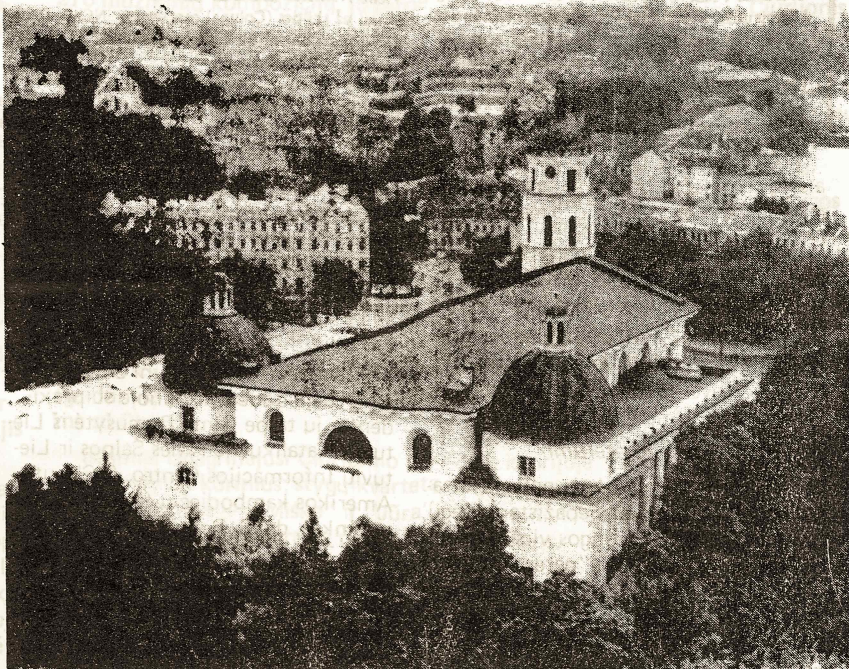
Lietuvos sostinės Vilniaus širdis - katedra, 1989 metų vasario 2 dieną sovietinės valdžios gražinama tikintiesiems

- Nijolė Sadūnaitė dabar laisvai gyvena Lietuvoje, o kun. Svarinskas -