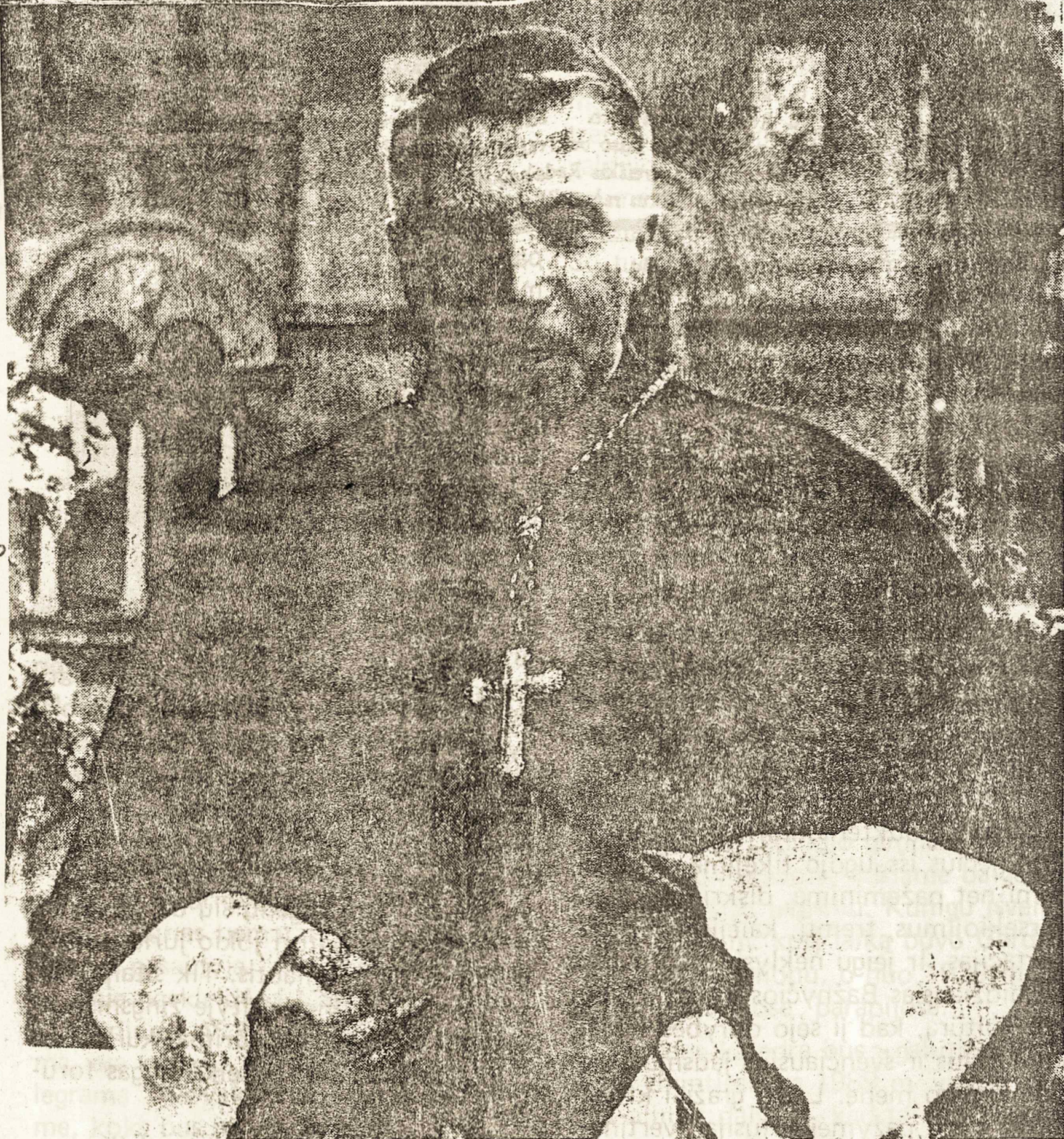
Jo Eminencija Lietuvos kardinolas VINCENTAS SLADKEVIČIUS

KARDINOLAS. Mūsų tautos kilni krikščioniška laikysena, lietuvių tautos didžiosios asmenybės Jogaila, Vytautas, šventas Kazimieras, vyskupai Giedraitis, Valančius, mūsų šventovės ir kilnus krikščioniško gyvenimo būdas iškalbingai liudija Bažnyčios įnašą į Lietuvos kultūros vystymąsi. O tiksliau ir teisingiau nesugebesiu įvertinti ir apsaakyti