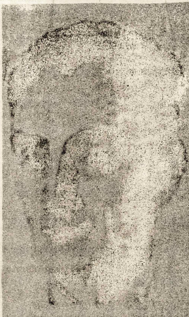
Rašytojas OSKARAS MILAŠIUS

Rašytojas Oskaras Milašius, buęs Lietuvos atstovas Prancūzijoje, pagarsėjo savo raštais prancūzų kalba ir susilaukė plataus dėmesio prancūzų visuomenėje. Jis mirė prieš 50 metų Paryžiuje, tačiau jo atminimas tebėra gyvas ypač literatūrinuose sluoksniuose. Paryžiuje yra sudaryta speciali draugija "Les Amis de Milosz" (-Milašiaus bičiuliai), kuri organizuoja plataus masto renginius Paryžiuje Velionies mirties 50-čio proga. Draugijos garbės pirmininkas yra lenkų rašytojas Nobelio premijos laureatas Czeslaw Milosz. O ir mūsų Oskarą