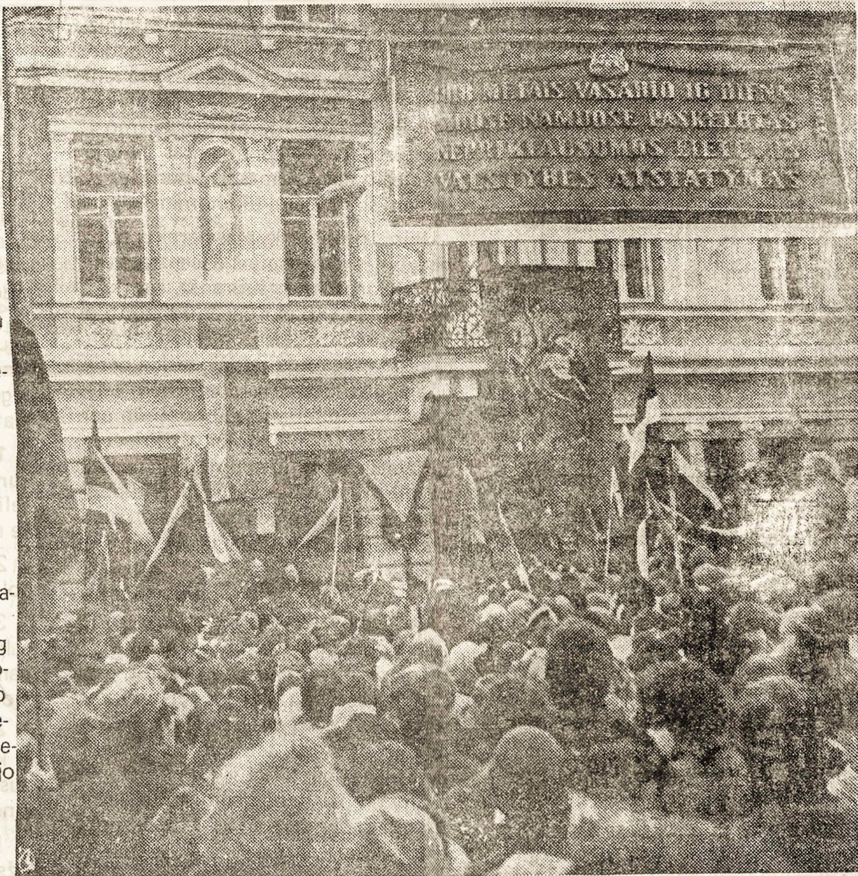
Šių metų iškilmingas Vasario 16-sios minėjimas Vilniuje

lijos lietuvių kolonijos būtų stiprinama lietuviškos ir jvairiapusis lietuviškas veikimas.