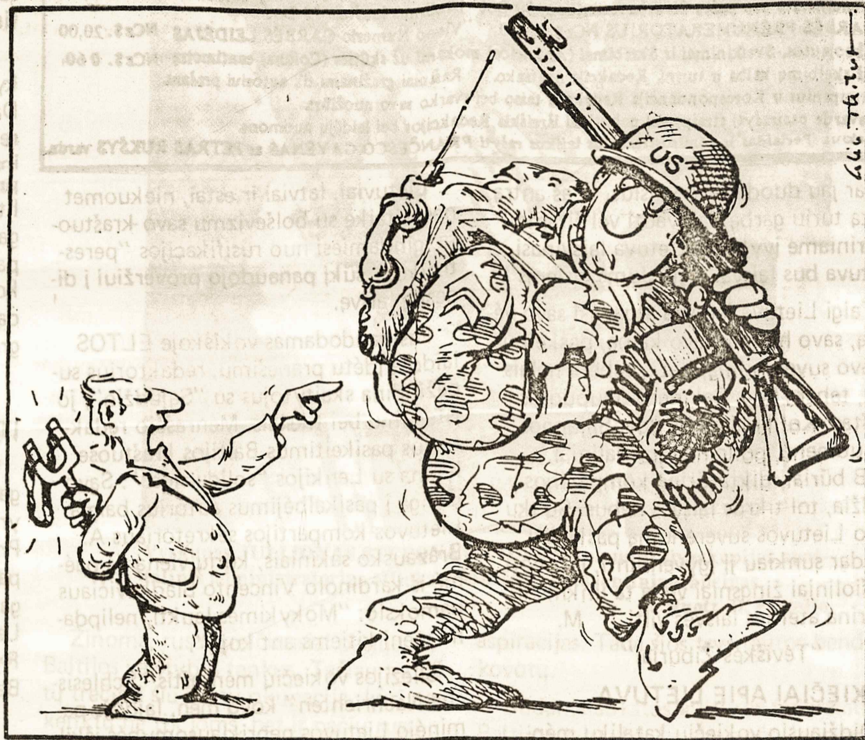
Po Gorbačiovo pasiūlyto 'nusiginklavimo', europietis amerikiečiui kariui... – Mes viską turime savo apsigynimui! ...

Lietuvos pilietybę nustato bei tvarko Lietuvos respublikos pilietybės įstatymas (31 str.). "Lietuvos TSR piliečius už Respublikos ribų gina ir globoja Lie-