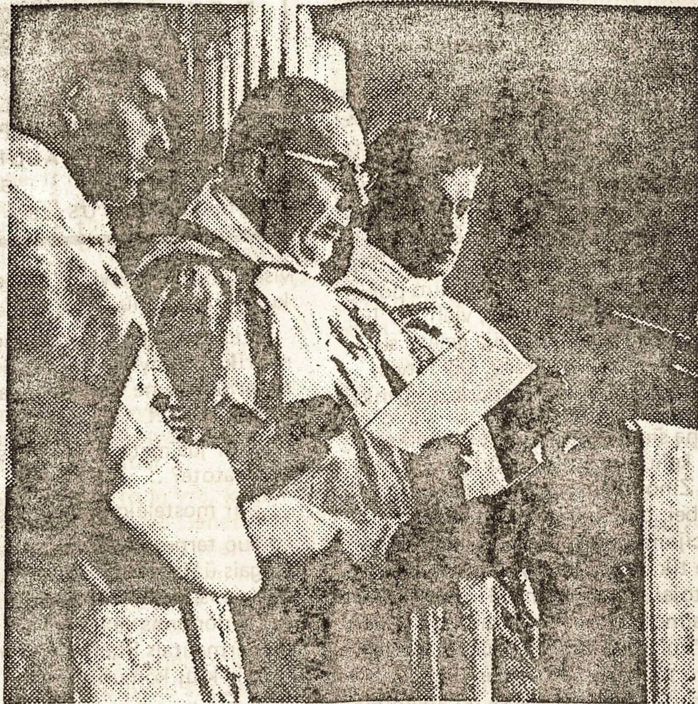
Vyskupas JULIJONAS STEPONAVIČIUS – Vilniaus arkivyskupijos apaštalinis administratorius atlieka arkikatedros atšventinimo apeigas

Dėl antrojo atvejo: reikalauti Lietuvai gražinti nepriklausomybę, žinant, kad rusai jos negražins, taip pat yra tik burnos aušinimas. Jie Lietuvos nepasiskolino, bet jeigu ją užėmė, todėl mums lieka tik viena išeitis – ją patiems atsiimti, ir tuojau pat, pasinaudojant “perestroikos” silpnąja puse, paskelbti Lietuvą nepriklausoma valstybe ir tuo būdu atsiskirti nuo Sovietų Sąjungos. Tai turėtų kartu padaryti ir Latvija bei Estija.