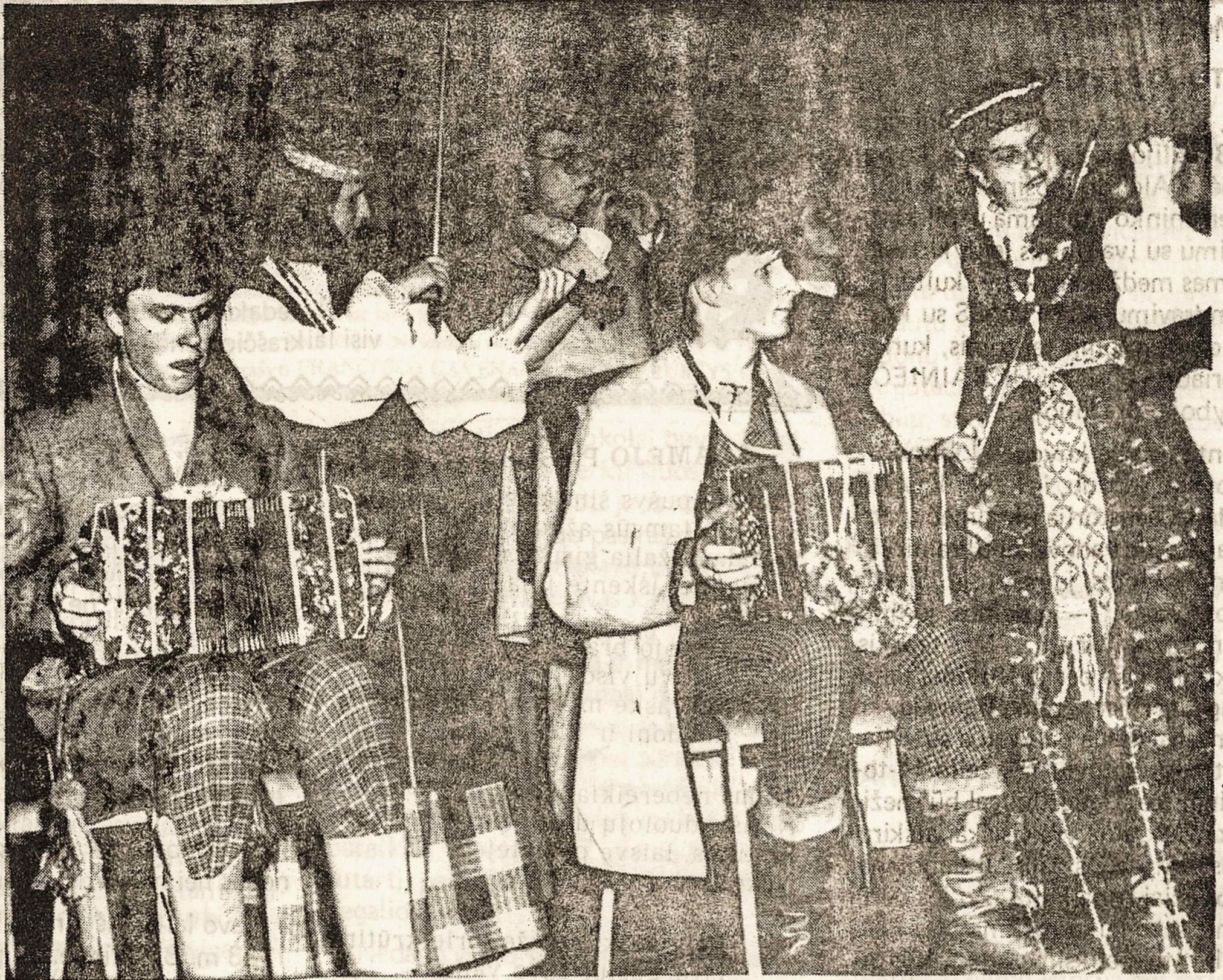
Vilniaus universiteto studentų folklorinio ansamblio "Ratilio" muzikantai, taip kaip kaimo vakaruškose, groja balandžio 19 d. Anapilyje įvykusiame koncerte