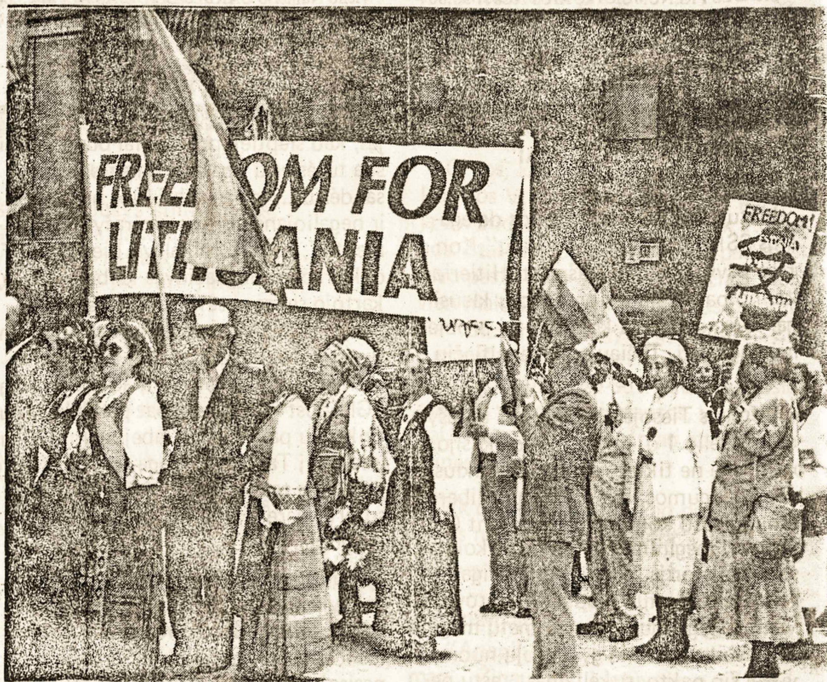
Sibirinių tremimų demonstracija birželio 14 d. Čikagoje

Atsakymas: Tokių Sovietų Sąjungoje nėra.