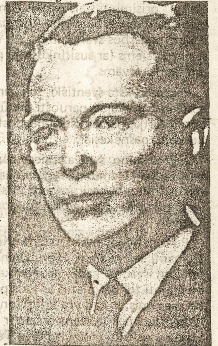
ANTANAS ŠABANIAUSKAS garbiausias Lietuvos pramoginės muzikos artistas naujai įgrotojų gražiausių interpretacijų juostelėj. “MŪSU LIETUVA”