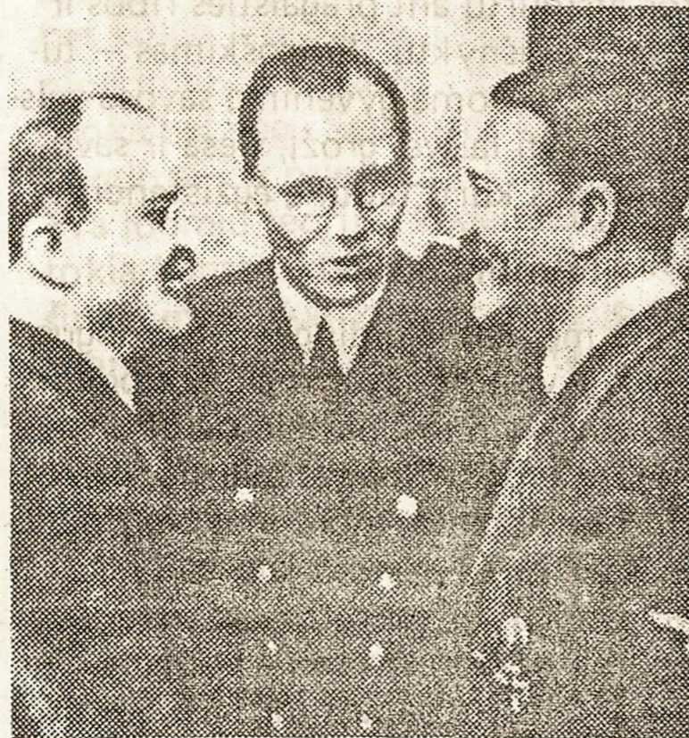
"Draugai" Molotovas (kairėje) ir Hitleris (dešinėje) 1940 m. lapkričio 12 d.

Momentas buvo tinkamas. Vokiečių armijos kovojo Vakarų fronte, anglų ir