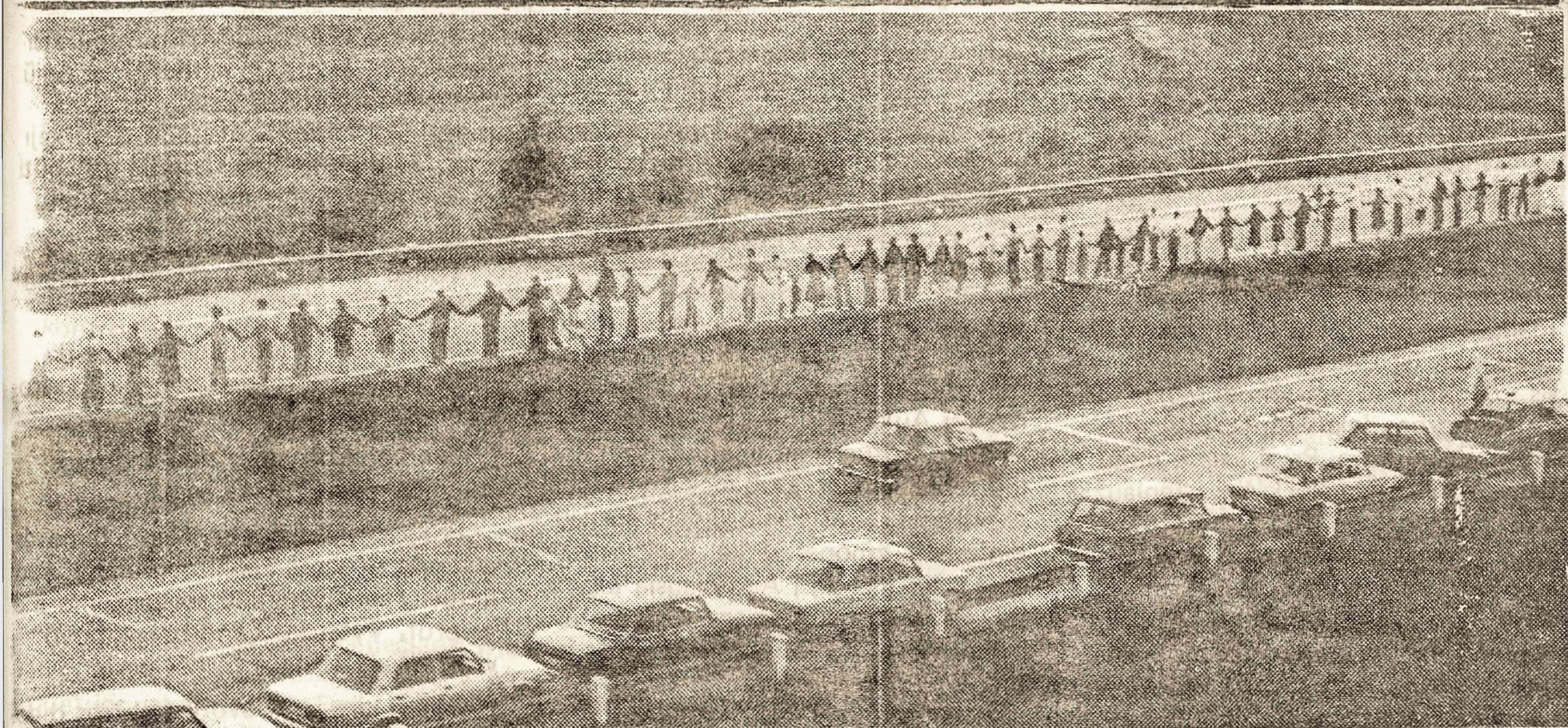
GIMTOJO KRAŠTO atspausdinta labai reikšminga nuotrauka rodo dalį žmonių grandinės 600 kilometrų, kuri sujungė Vilnių su Tallin'u per Rygą, protestuojant prieš Molotovo—Ribbentropo slaptų susitarimų pasirašymo penkėsdešimtmetį