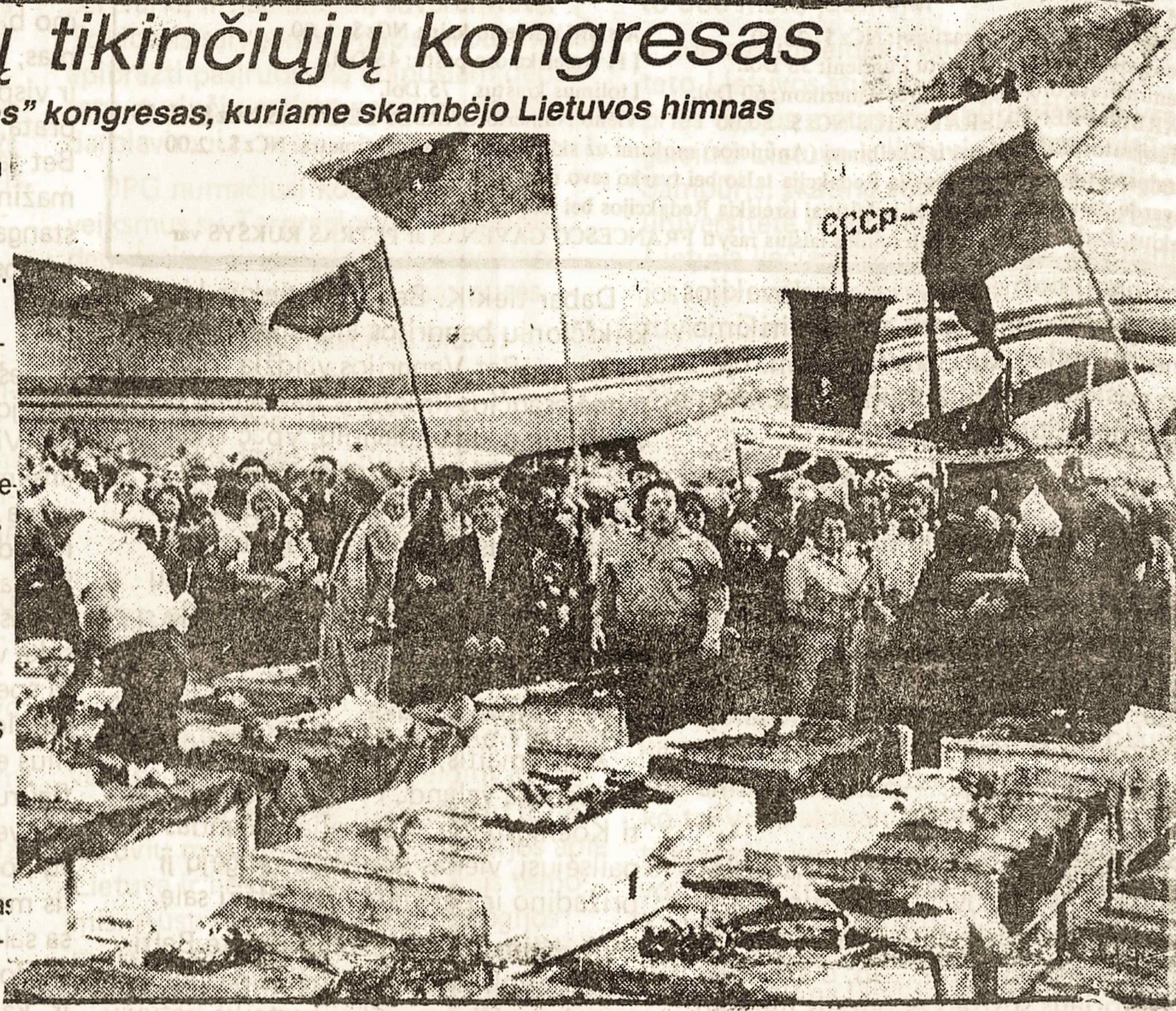
Tremtinių palaikų karstai atvežti į Kedainių aerodromą. Juos pasitiko žmonių minia Lietuvos autobusu atvyko Vilniaus universiteto ansamblis. Šią nuotrauką įsidėjo The New York Times rugpjūčio 3 d. numeryje.