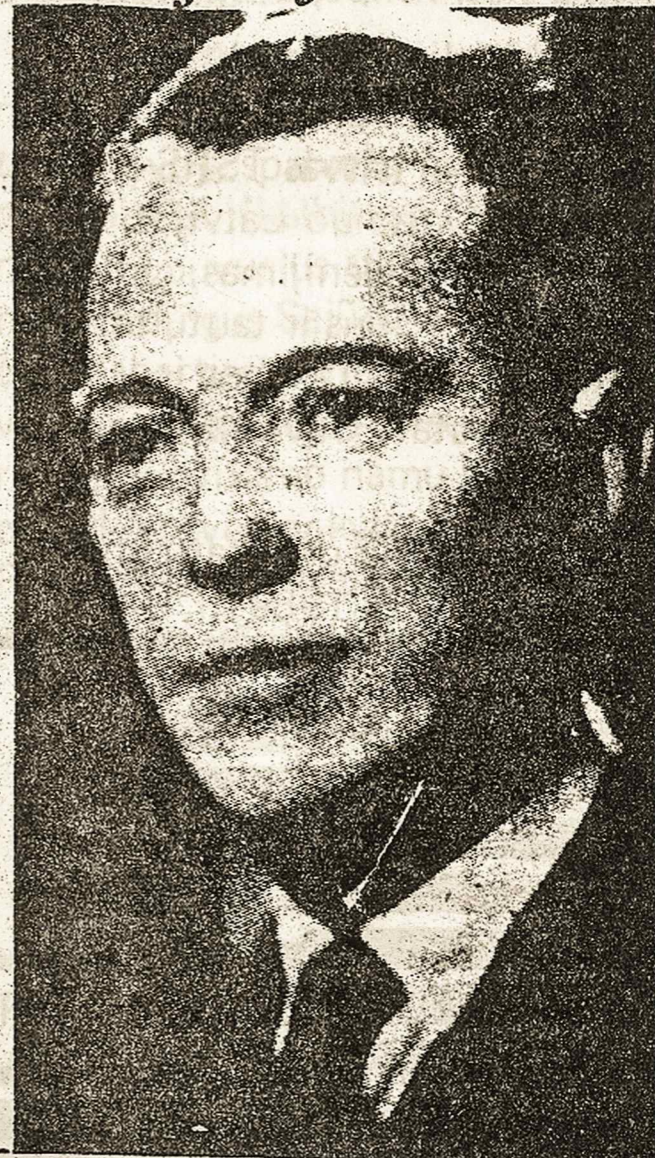
ANTANAS ŠABANIAUSKAS garsiausias Lietuvos pramoginės muzikos artistas naujai įgrotojo gražiausių interpretacijų juostelėj. "MŪSŲ LIETUVA"