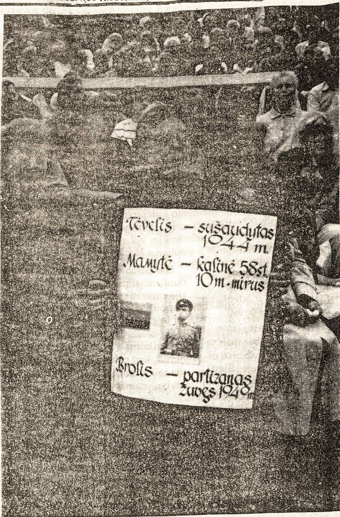
Vienos lietuvis skausmas. Nuotrauka daryta 1989.VIII.23 d. Kalnų parke, Vilniuje.

Šiems rinkimams lietuvių tauta pasipriešino, savo noru balsavo ne daugiau kaip 5 proc. apie 85 proc. lapelius į urnas turėjo sukišti patys bolševikai. Kelėtą dienų prieš rinkimus bolševikiniai agentai platino gandus, kad nebalsavusieji bus vežami į Sibirą.