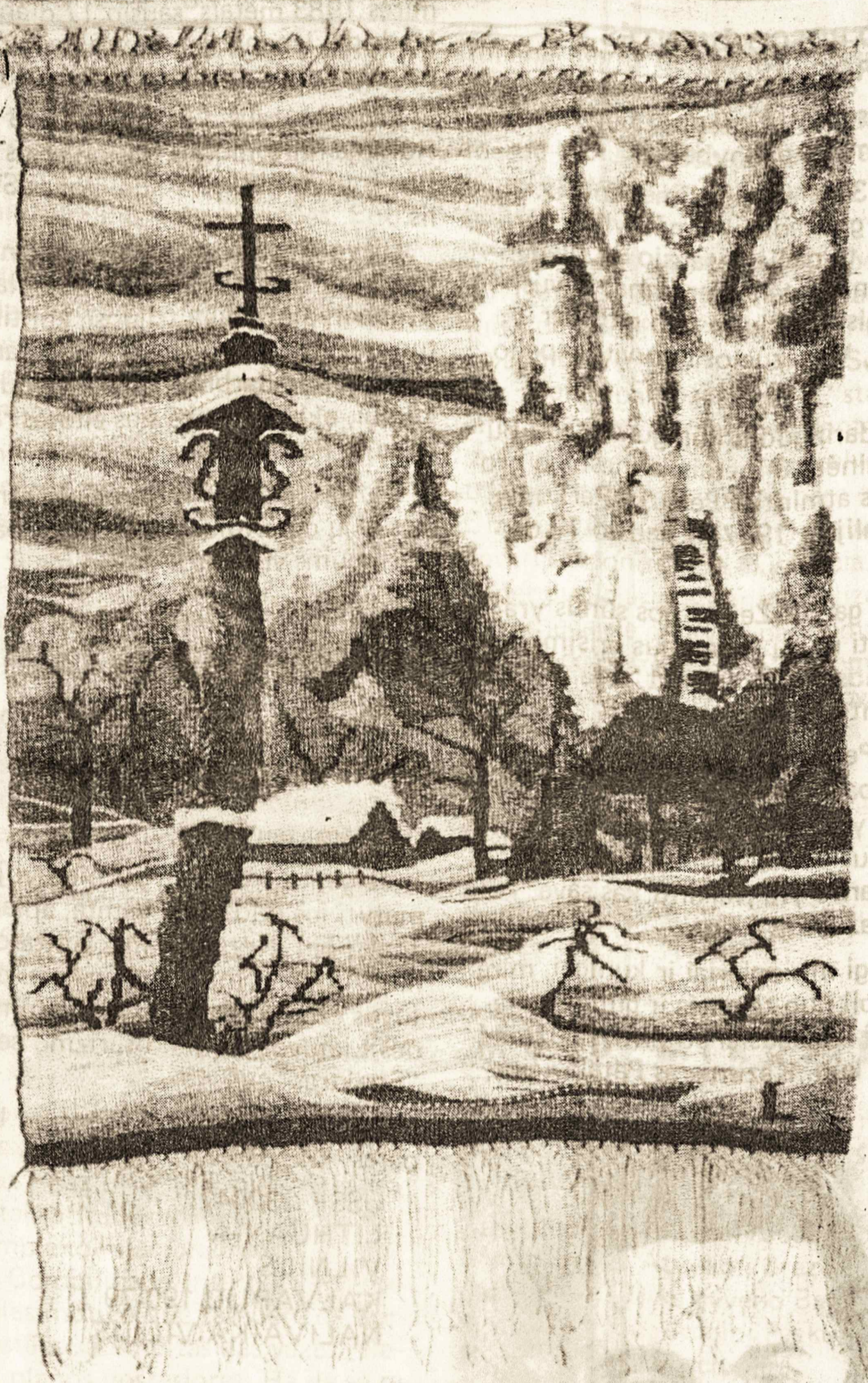
L. Nakrošienė, ŽIEMA LIETUVOJE. Gobelenas