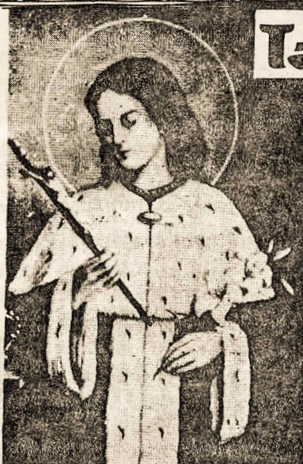
Šv. Kazimieras Lietuvos ir viso pasaulio lietuvių jaunimo globėjas