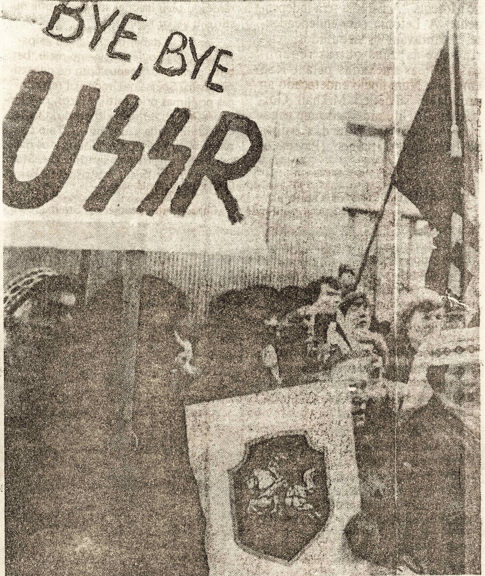
Um manifestante lituano dá adeus à URSS em frente ao parlamento

A Lituânia tornou-se ontem a primeira república soviética a separar-se da URSS. O Soviete Supremo lituano (Parlamento), numa sessão marcada pela emoção, restabeleceu a independência do país e elegeu um novo presidente — o musicólogo Vytautas Landsbergis, 58 anos, líder do movimento nacionalista Sąjudis, que fez a