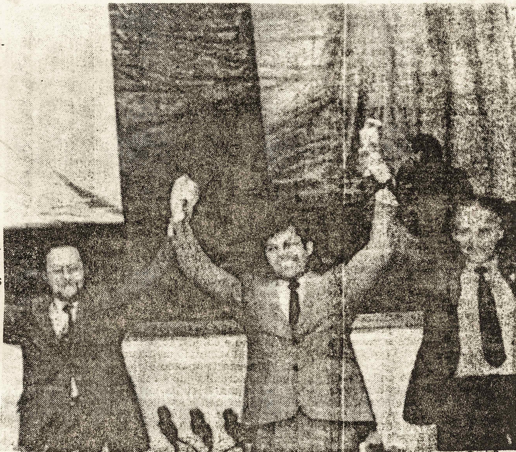
Lietuvos Parlamentas pergales ženkle po vienbalsio Lietuvos Respublikos Nepriklausomybės nubalsavimo. Kairėje VYTAUTAS LANDSBERBERIS išrinktas Lietuvos prezidentu.