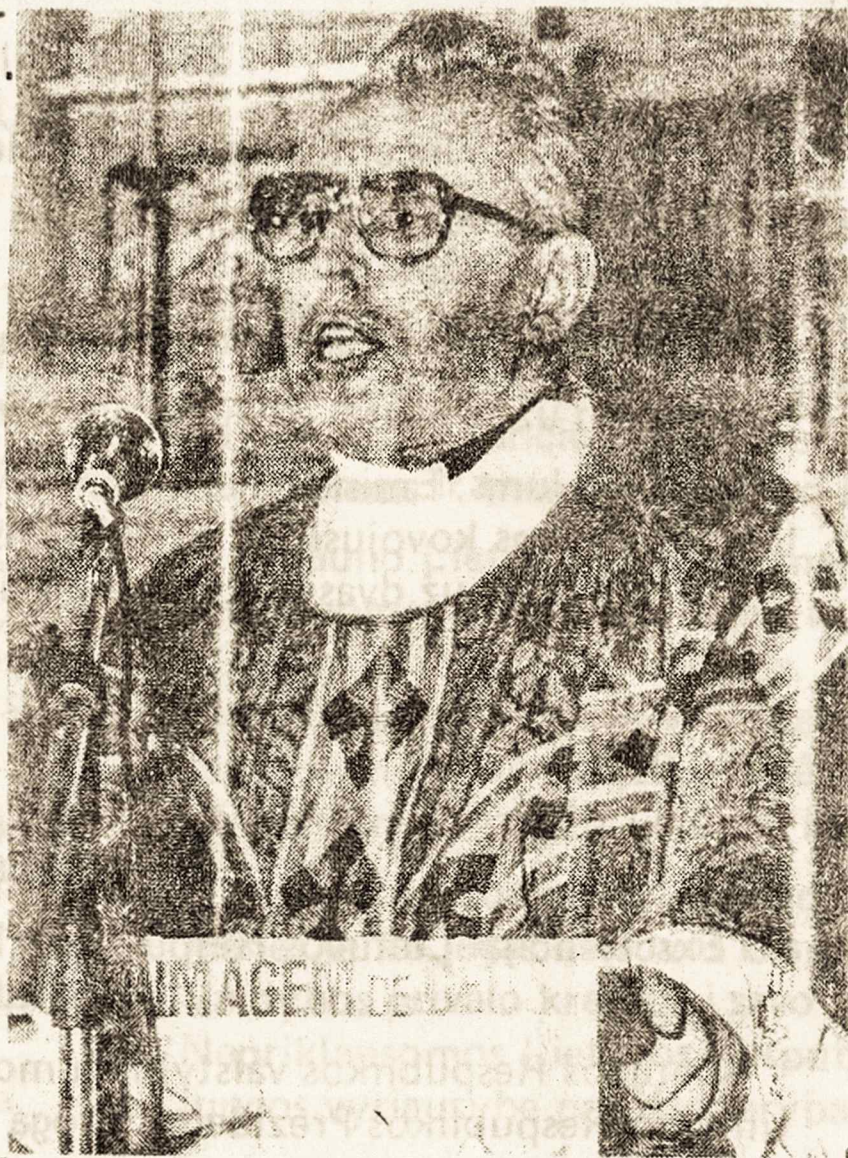
Alfonsas Svarinskas durante sermão na Igreja de São Paulo, 14.03.90

Kovojančios, bet nenugalėtos tautos vardu dėkoju Brazilijos lietuviams už