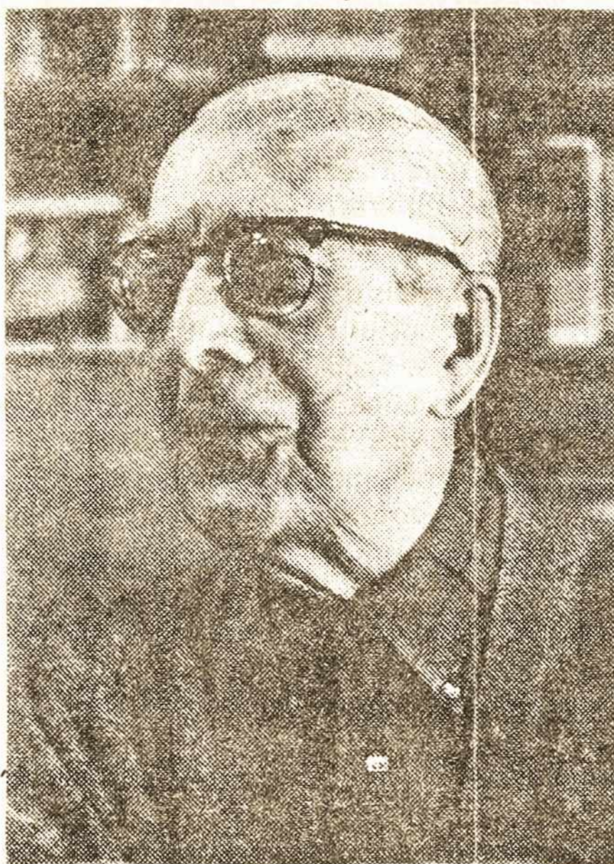
ly. Dabar svarbiausia įtvirtinti Lietuvos Komunistų partijos savarankiškumą.

— Aš tuo labai džiaugiuosi, ypač vertinu Sąjūdžio veiklą. Kitos atsikūrusios ir naujos partijos kol kas turi mažai šalininkų. Tegul jos gyvuoja, vystosi, tampa organizuotesnės ir visos drauge siekia pagrindinio mūsų tikslo bei mažesnių tiks-