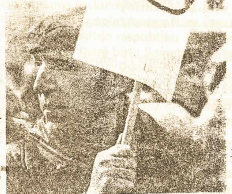
Maskvoje žmonės protestuoja priešsovietinius tankus Lietuvoje. Balandžio 2 d.

galimybės. Bet tai juk derybų, gal ir labai ilgų, klausimas, neužkertęs kelio vakariečiams praktiškai kokiais nors žodžiais išreikšti moralinę paramą ir kartu pasidžiaugti, kad jų deklaruota nepripažinimo politika pagaliau susilaukusi pagarbą įvertinimo, nes tikrai atstovavusi teisėtumui. Pareiškimų uždelsimas ar iš viso baisyti tylą atskleidžia tik dvivediškumą, didinantį nusivylimą ir šio krašto vyriausybę. Č.S.