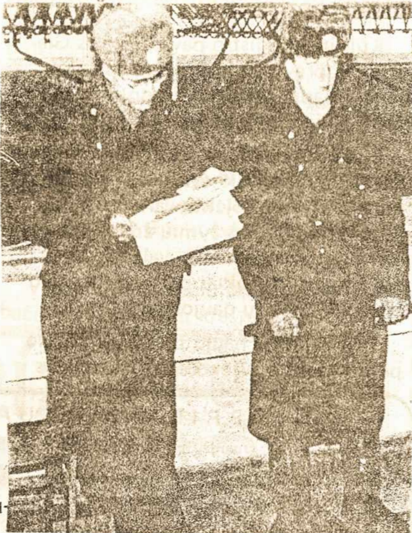
Rusų kareiviai patruliuoja užimtas Vilniaus laikraščių ir žurnalų redakcijas. Nuotr. iš FOLHA DE S. PAULO, balandžio 4 d.

Tiesa, reikia sutikti, kad penkiasdešimt metų užsitęsusi raudonoji klampynė, kartu su savimi gramzdinusi ir mūsų tautą, painiojusi, rišusi įvairiais mums nepriimtinais ryšiais, darkiusi tautinį, religinį, moralinį ir ekonominį gyvenimą, vis dėlto įstengė pakeisti mūsų padėtį, labai ap sunkino greitesnio ir visiško išsilaisvinimo