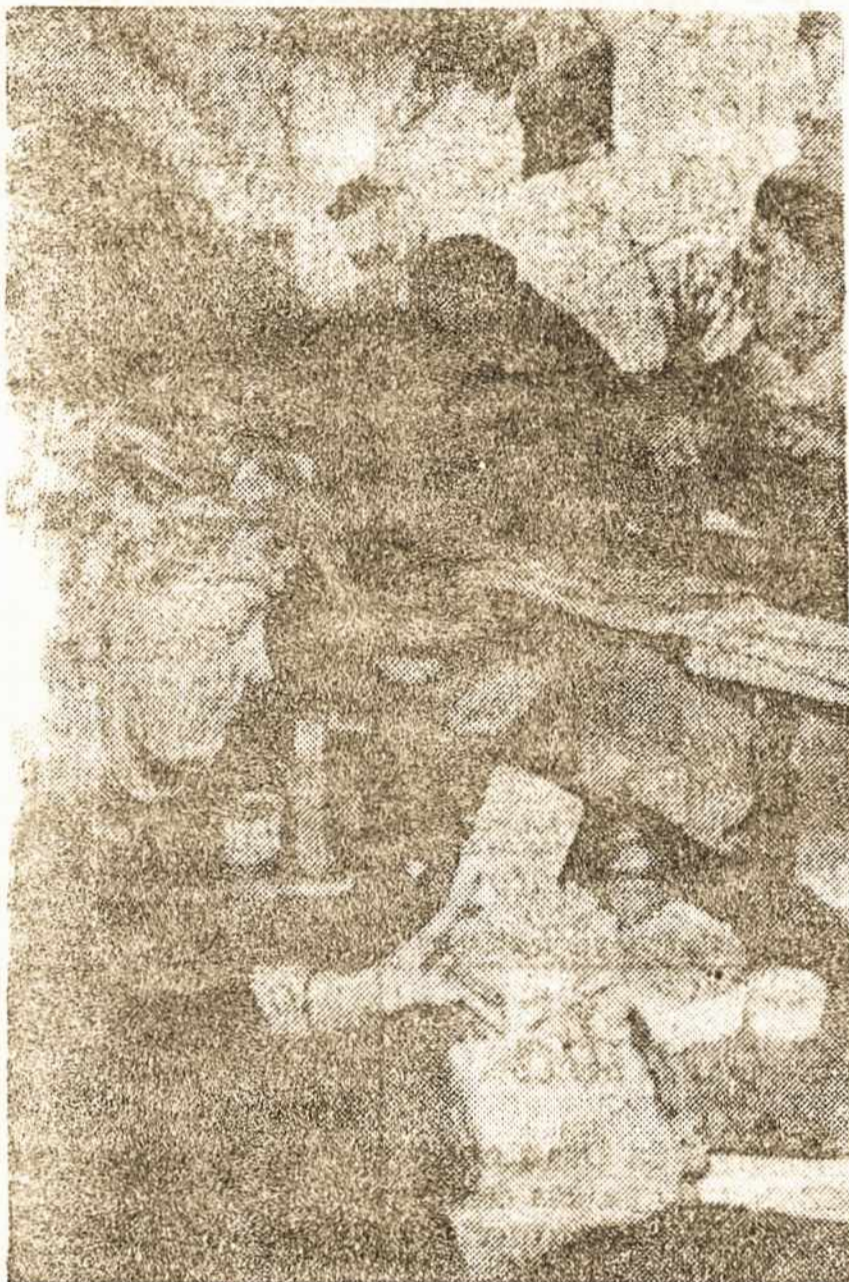
France Presse e Assoc

Paskutinėm savaitėm Lietuva yra tapo Brazilijos spaudos dėmesio centru. Pirmausia kai kovo 11 d. paskelbė nepriklausomybę, o vėliau, kai rusai pradėjo grąsinti jėga. Deja iš lietuvių spaudos agentūrų žinios vėluoja, o vietinėj spaudoj kasdien pasirodo ilgi straipsniai. Mes neturime laiko tų straipsnių versti, tai mėginsime viešąją kitą tiesiog perspausdinti.