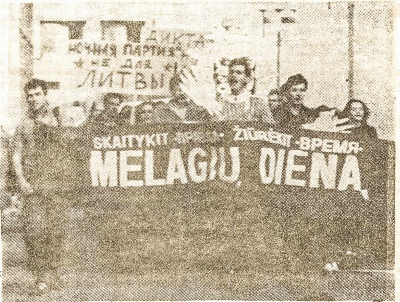
VILNIUS: jaunimas demonstruoja prieš lietuviškų laikraščių ir žurnalų užėmimą. dras džiaugsmas. siunčiami sveikinimai ir ambasadoriai.

Tiesa, reikia sutikti, kad penkiasdešimt metų užsitęsusi raudonoji klampynė, kartu su savimi gramzdinusi ir mūsų tautą, painiojusi, rišusi įvairiais mums nepriimtinais ryšiais, darkiusi tautinį, religinį, moralinį ir ekonominį gyvenimą, vis dėlto įstengė pakeisti mūsų padėtį, labai ap sunkino greitesnio ir visiško išsilaisvinimo