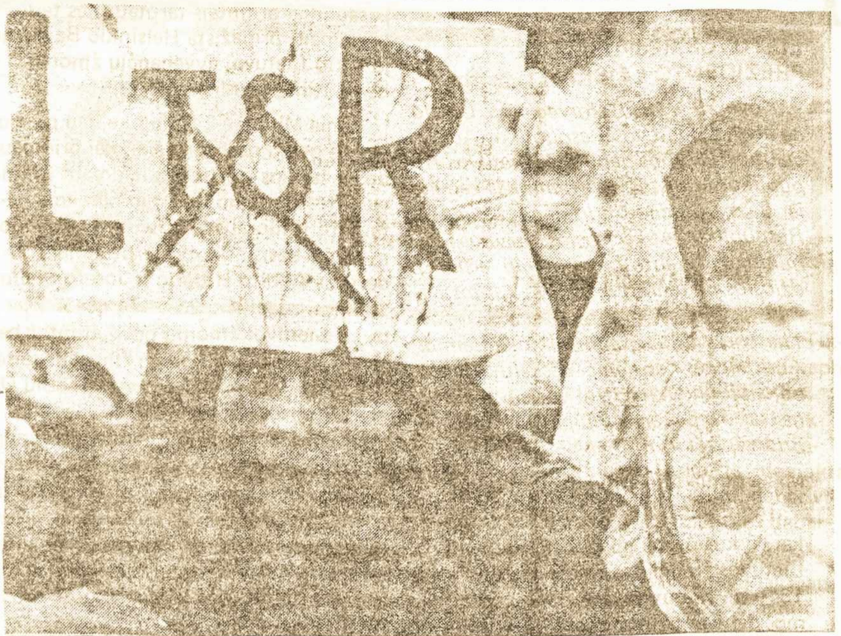
VILNIUS: lietuviai demonstruoja už LIETUVOS RESPUBLIKĄ.

Nenustojam vilties, kad sukurs demokratijos ir Lietuvos draugai svetimtaučiai, bet tuo tarpu ir nedelsiant į pagalbą šauksmą privalome atsiliepti mes, išeivijos lietuviai. Lėšos yra viena svarbiausių pagalbos formų. VLIKas yra pavedęs Tautos Fondui šią finansinę pagalbą organizuoti ir tvarkyti. Mes žinome šio pavidimo svarbą ir ėmėmės šio uždavinio žinodami, kad Tautos Fondo nariai jam pritarė. Tautos Fondo narių sutelktom lė-