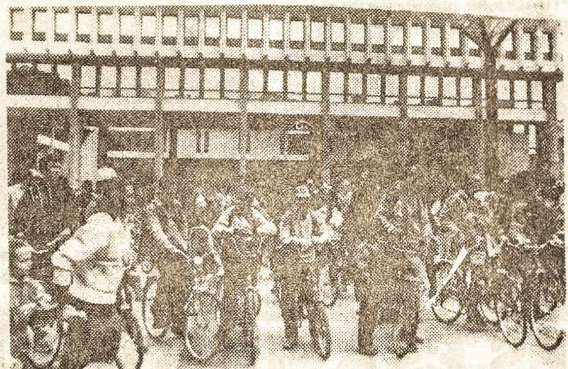
Balandžio 29-ąją dviračiais važiovom nuo Aukščiausiosios Tarybos rūmų į Valakampius. Kolona nusitęsė 2 km. Pedalus mynė ir šeši „G. k.“ bendradarbiai. Iš žyglio lozungų: „Kiškite savo naftą ten, kur saulė nešviečia“ ir „Moterys myli Lietuvos dviratinkus“.