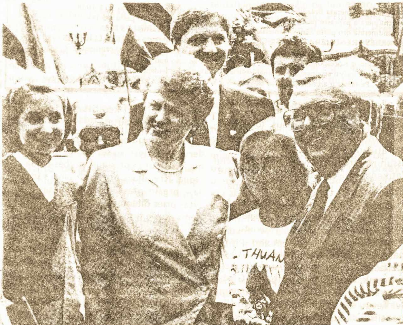
Ministerė Pirmininkė KAZIMIERA PRUNSKIENĖ, tarp demonstruojančių lietuvių prie parlamento rūmų Otavoje.

François Mitterandas, kuris gegužyje vyksta Maskvon (jis lankosi Sov. Są-