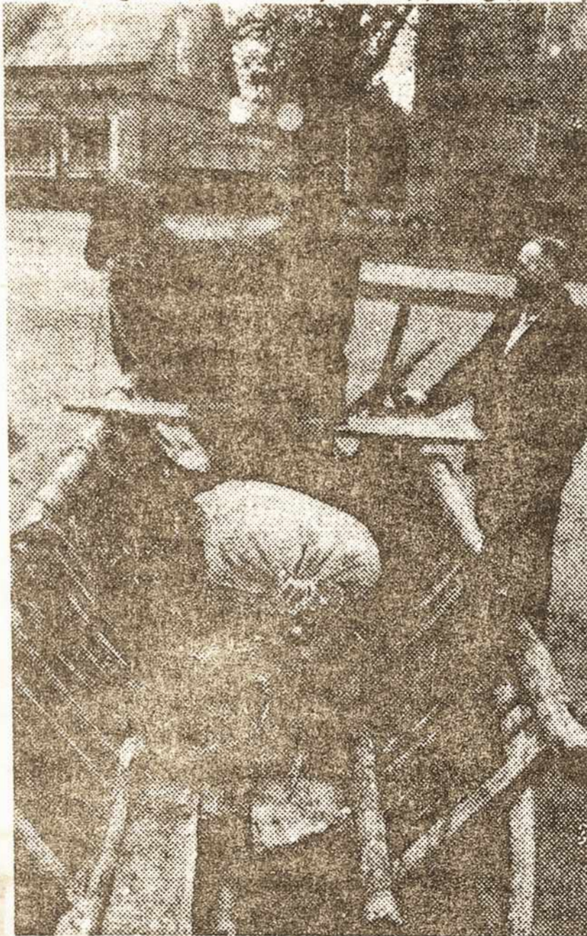
Lietuviai spiriasi prieš rusų ekonominį boikotą

Stokojant kuro katilinėms, tenka laikinai nutraukti karšto vandens tiekimą gyventojams. Savivaldybėms kartu su šiluminiais tinklais pavesta užtikrinti reikiamą ligonių, ikimokyklinių įstaigų, vie-