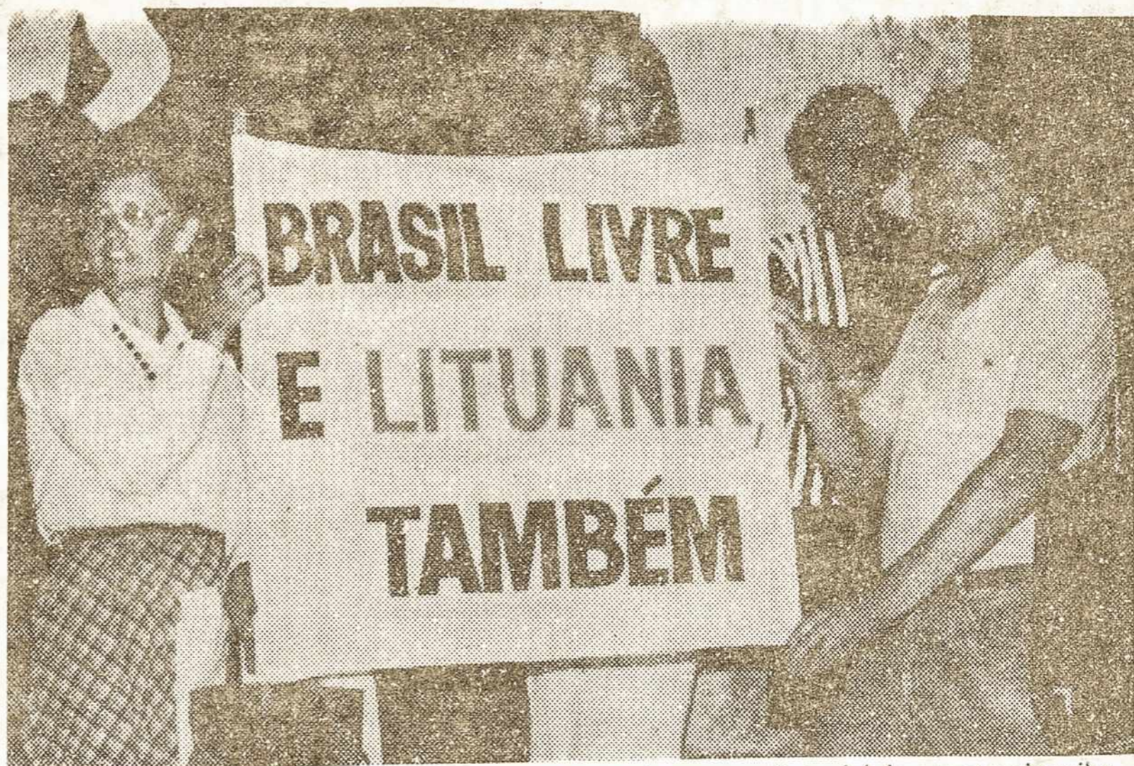
S. PAULO – Avenida Paulista: priešais TV GAZETA pastatus lietuviai demonstruoja reikalaudami laisvės Lietuvai. Per parašų rinkimo vakarą lietuviai surinko 15.000 parašų

1987 m. Velionis vyko aplankyti savo tėvų žemę Lietuvą. Bet jis rūpinosi, kad ir jo žmona ir abi dukros vyktų kartu ir pažintų jo mylimą tėvynę. Išivaizduoju, kaip jautriai Velionis, sun-