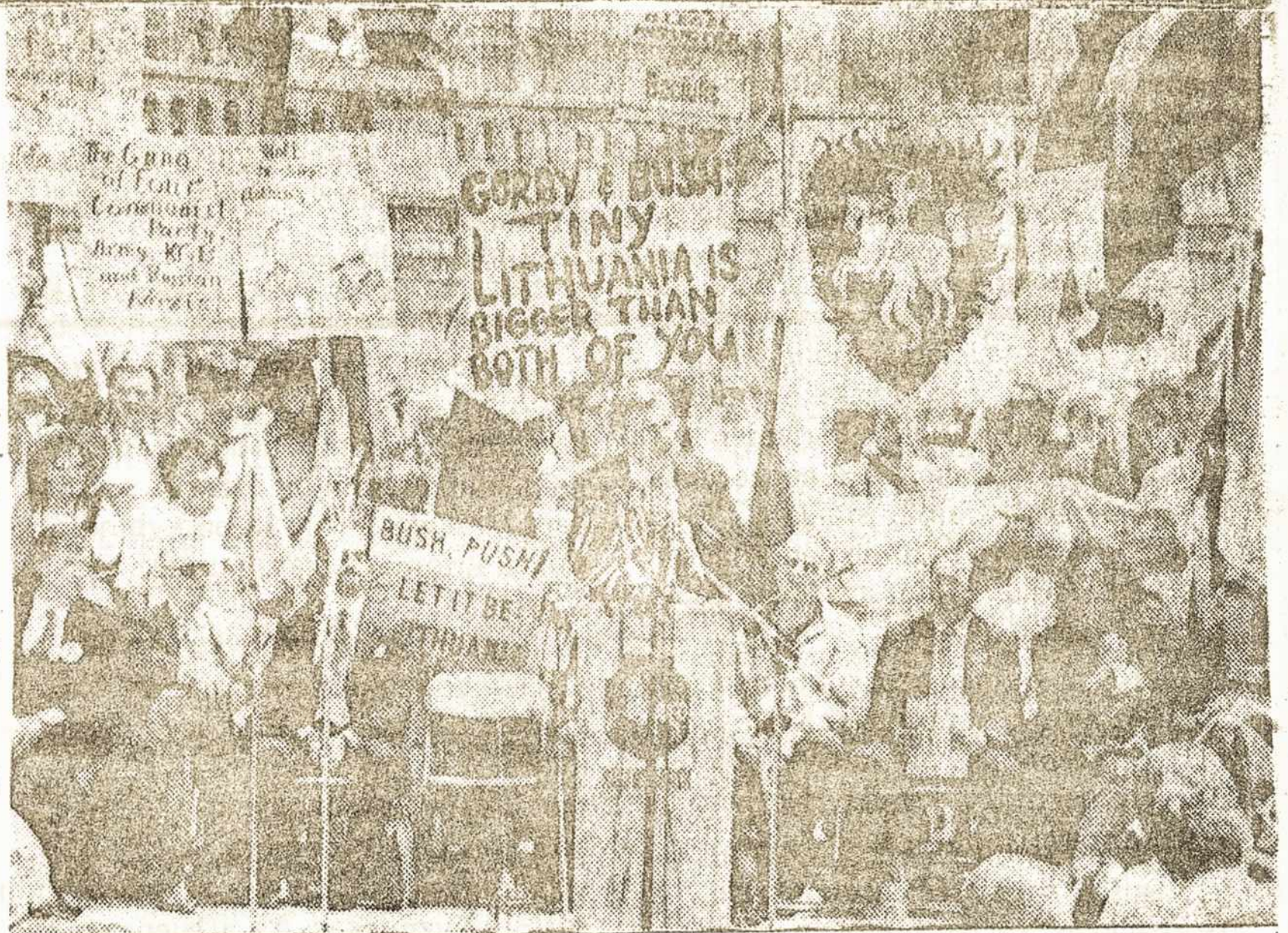
Demonstracijos Washingtone prie Kongreso laiptų. Tribūnoje kalba Lane Kirekland, AFL-CIO unijos vadas.

Gerai, kad su politiniu nepriklausomybės siekimu lygiagrečiai, nors gal ne tuo pačiu greičiu, eina ir tautos atgimimas, jos grįžimas į kelią, kuris prieš penkiasdešimt metų buvo jėga užtvirtas. Istorinėje perspektyvoje iš tikrųjų toji pusė šimtmečio tėra mažytis taškelis. Vienok tiek laiko užtenka užaugti vienai kartai ir užgimti naujai. Atgimimo rūpestis kaip tik ir nukrypsta į tuos