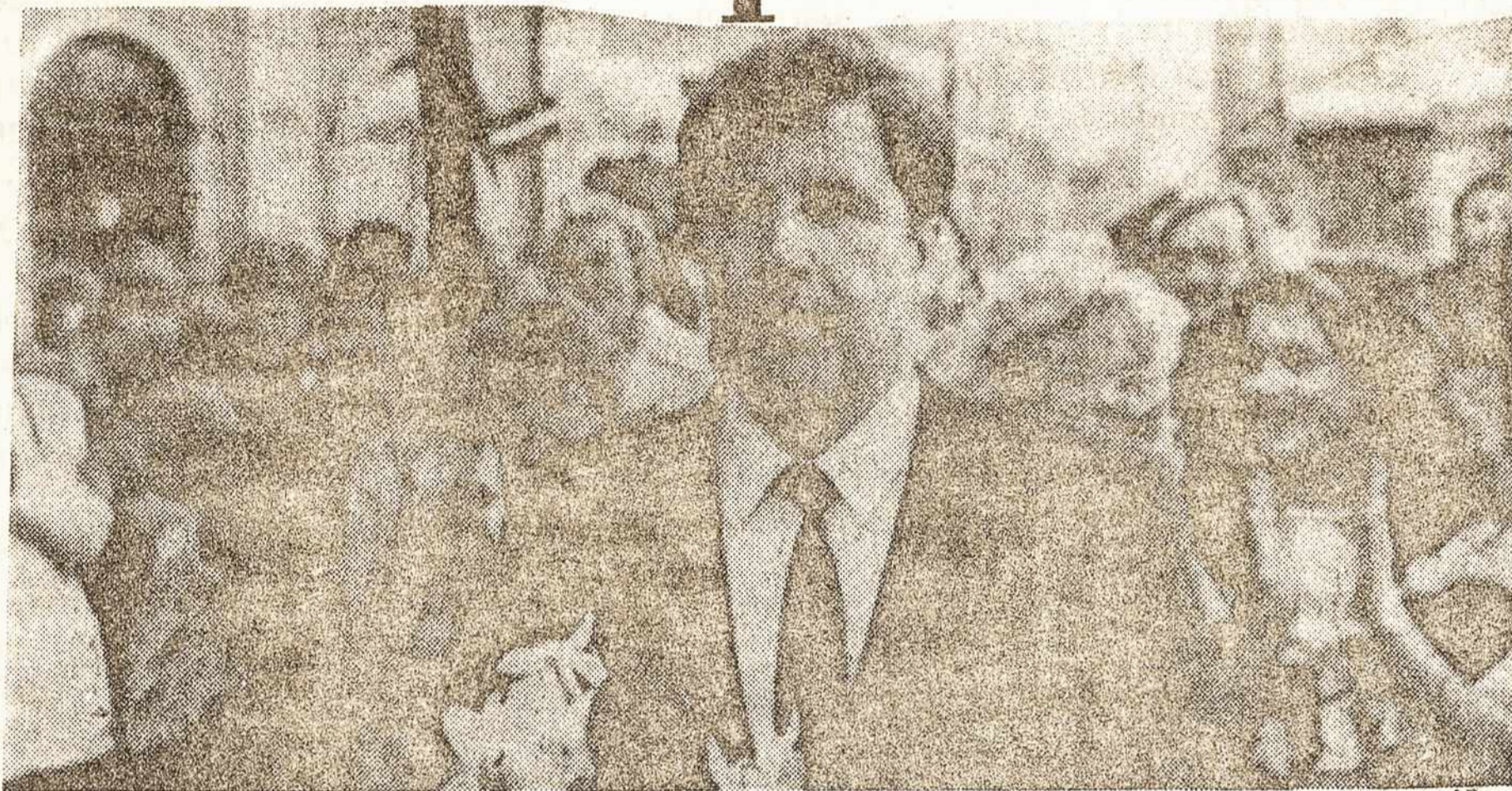
O presidente letão, Gorbunov, é aplaudido em Riga: oferta de conciliação