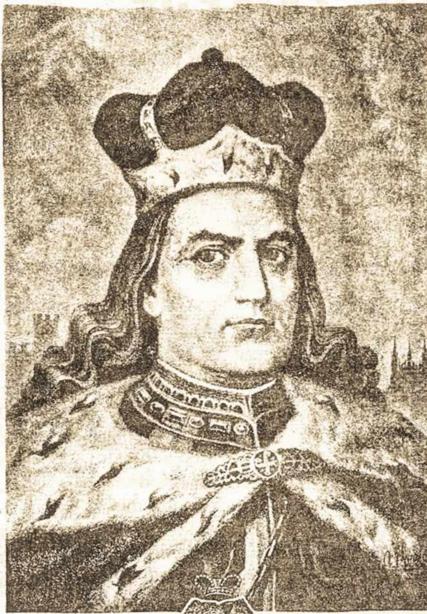
DID. LIETUVOS VYTAUTAS KUNIGAIKŠTIS VIESPATAVO DIDYSIS 1392-1430

Ir daugiau nešvarių sutarčių būtų kuriais Ordinas labai pasipelnė. Vokiečiai Kęstučio žemes mygo visu smarkumu, kai nesutikimas tarp Jogailos ir Kęstučio jau buvo pasiekęs aukščiausią laipsnį.