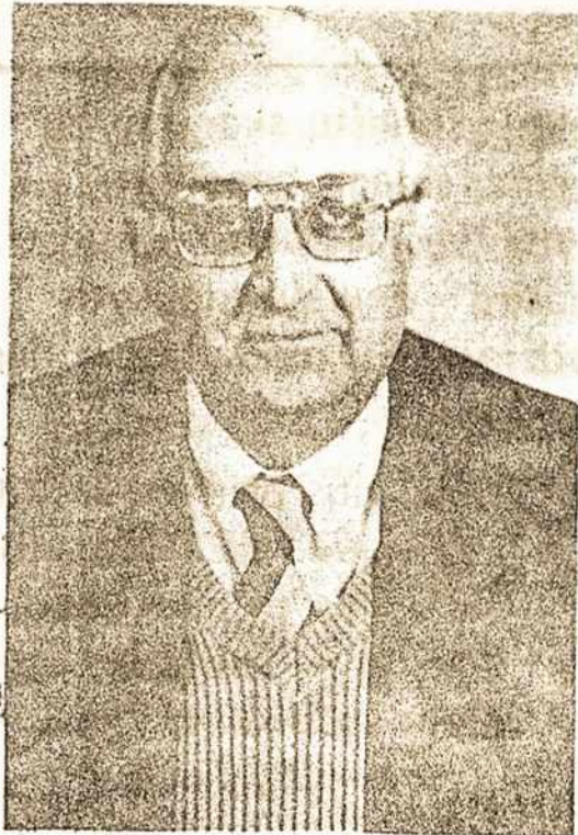
DEPUTADO ESTADUAL N.º 15.148