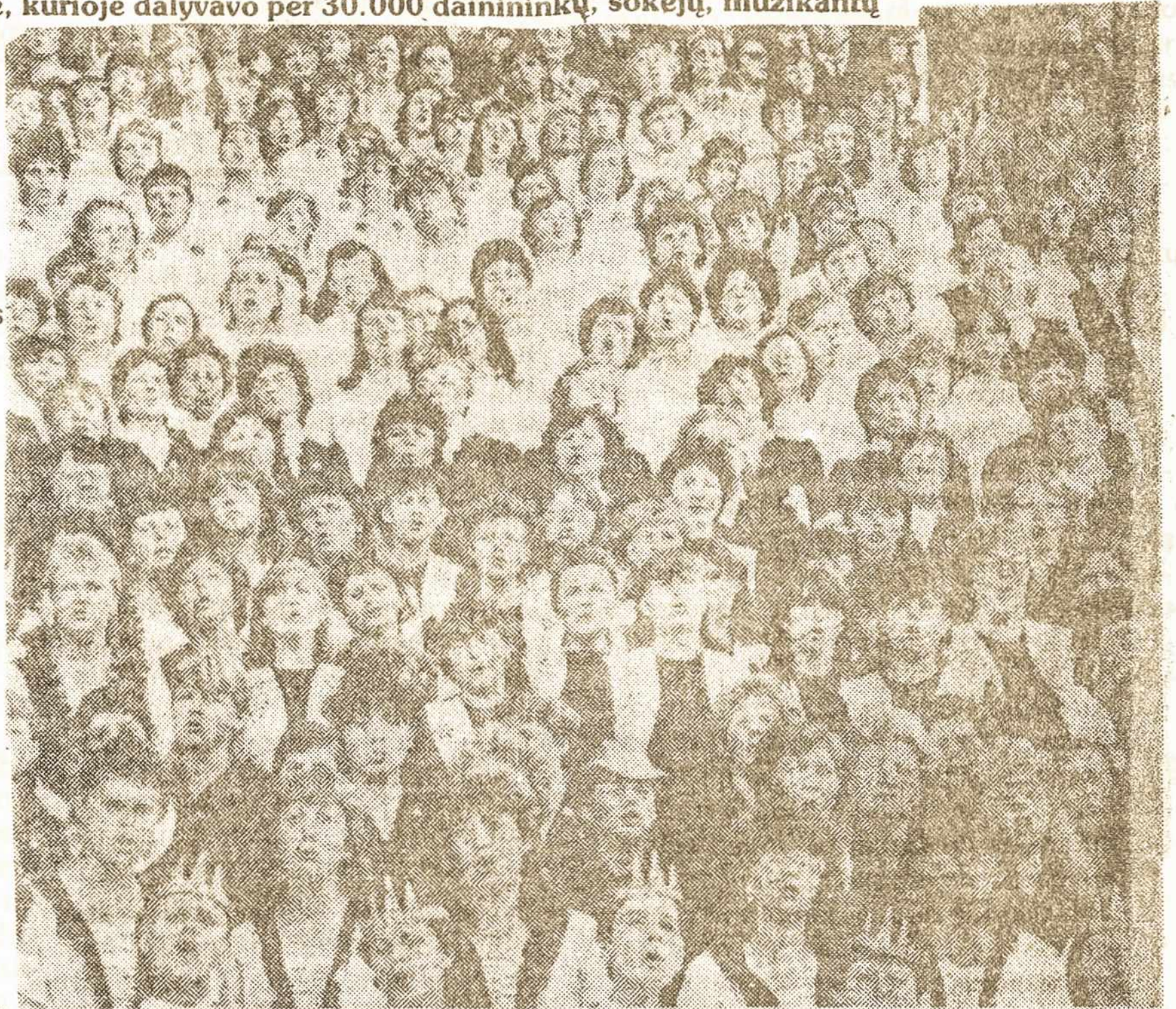
XIII-je Lietuvos tautinėje dainų šventėje dalyvavo 34.211 dainininkų, muzikantų ir šokėjų. Nuotraukoje dalis programos atlikėjų.

Po Mišių pabyra, pasklinda keturių Lietuvos kraštų ansambliai po senmies-