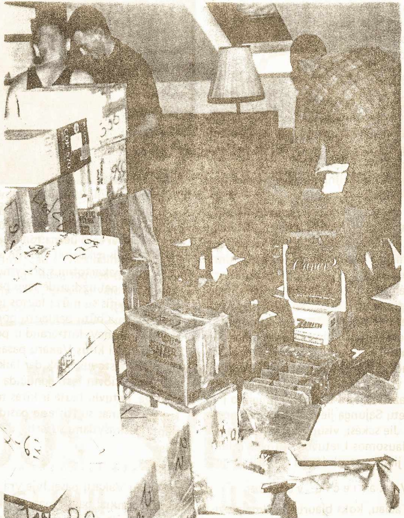
Lietuvių Katalikų Religinės Šalpos būstinėje New Yorke pakuojamos suraukotos knygos Lietuvai.

Knygas aukojo asmenys, organizacijos, bibliotekos ir universitetai iš New