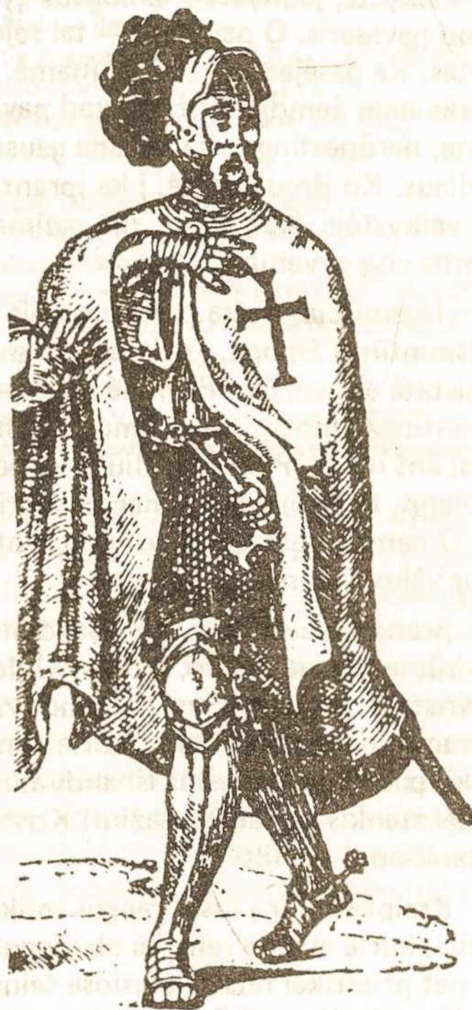
Kryžiuočių Ordino riteris

Tuo tarpu Vytauto giminaičiai buvo išsiuntinėti į atskiras pilies, o jam pačiam