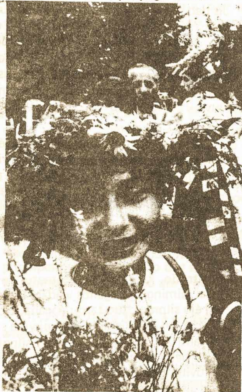
Lietuvos vaikai grįžta į mokyklą su šypsena

Kreipiamės ir į jus, brangūs moksleiviai, kurie augate religijai abejingose, gal net priešiška nustačiusiose šeimose. Jūsų tėveliai galbūt neturėjo galimybės giliau susipažinti su religija, katalikų tikėjimu. Ateistinės propagandos įtako-