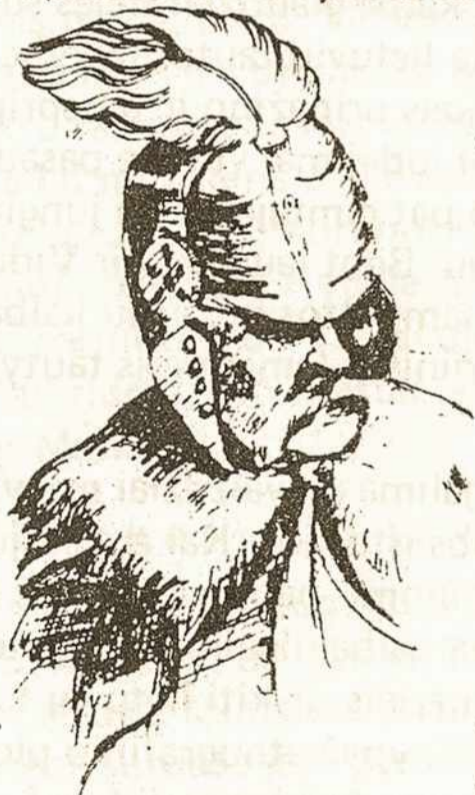
ŠVITRIGAILA ALGIRDO SŪNUS 1430-1432

Pirmas prieš Vytautą pekėlė ginklą Sievirsko — Naugardo kunigaikštis Dimitras Koributas, bet prieš Dokudovo buvo Vytauto sumuštas. Tuo pačiu laiku atsi-