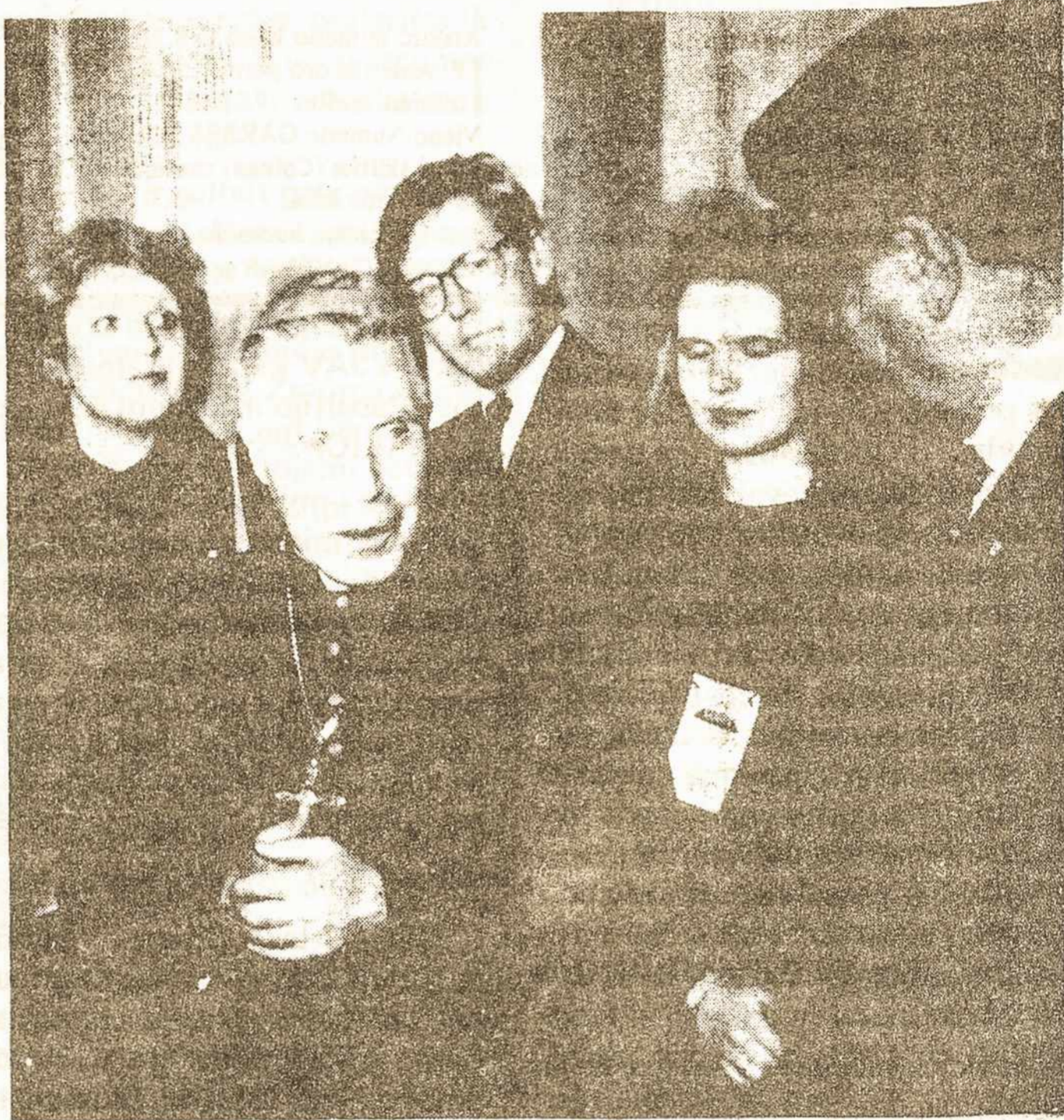
Mūsų kardinolas Vincentas Sladkevičius, rugpjūčio 20 d. šventė savo 70-ties metų sukaktį, užsienio korespondentų tarpe.

Po Kovo 11-tosios nepriklausomybės įgyvendinimo sunkumai palietė ne tik vadovaujančiuosius, bet ir visą tautą, vienai ar kitaip dalyvaujančią įgyvendinimo ėjimuose, laukiančią naudingų