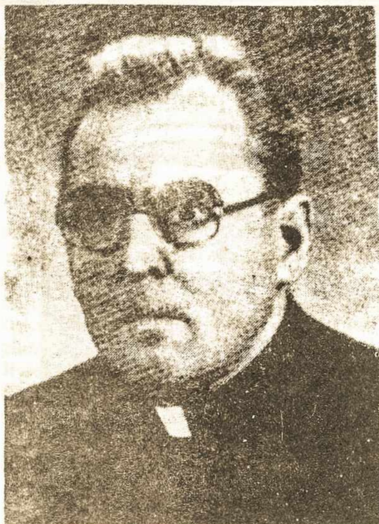
Kun. ALFONSAS SVARINSKAS

ėjusius rinkimus milijonierius Lerus nuskuto mokesčius. Jį nuteisė 15 metų. Dabar šluoja kalėjimo koridorius. Štai demokratija. Pasodintų spekuliantą, pardavinėjantį cigaretes po 2 rublius, pasėdėtų trejetą metelių, tai tada ir būtų demokratija.