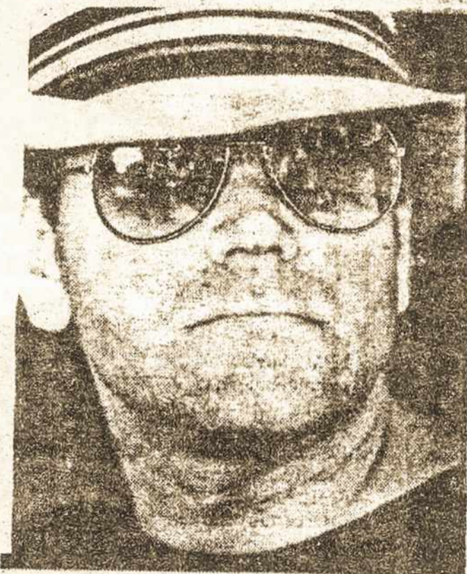
ROBERTAS ŽEMECKIS. filmų kūrėjas-režisierius

paskutinė tos Atgal į ateitį trilogijos dalis. matom jos herojus Marty Mc Fly (Michael J. Fox) ir Doc Brown (Christopher Lloyd), išsikaparnojusius iš Anno Domini, 2015, kad panertų į laukinių Vakarų baisųjį 80-tųjų dešimtmetį (1880-tųjų metų, savaimė suprantama). Mūsų Robertėlis, vadinasi, yra išlindęs po šešerių metų kiek apdujęs iš druskos kasyklų, kurios pavirto jam aukso kasyklom, bet jose jis buvo praradęs bet kokią laiko nuovoką.