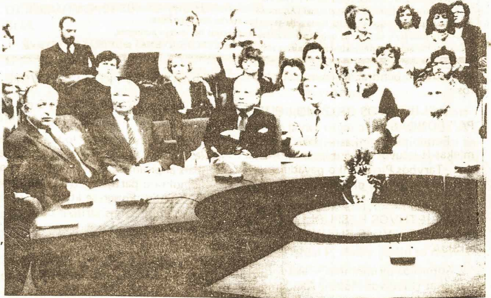
KAUNAS: spalio 8 d. įvykusio VII-to Lietuvos gydytojų suvažiavimo kardiologijos sekcijos posėdžio dalyviai

Komiteto lėšas sudaro Komiteto narių ir Lietuvos bei užsienio šalių organizacijų ar piliečių labdaringa finansinė parama, pajamos iš aukcionų, parodų