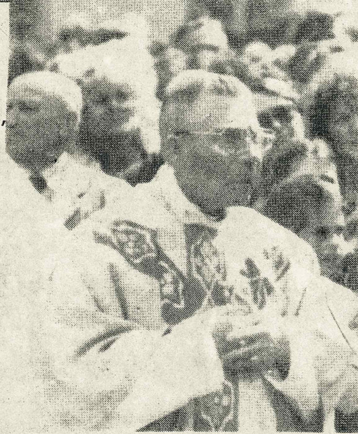
Kard. Vincentas Slatkevičius

Lig šiol daugiausia kalbėjome apie vyresniosios kartos pareigas jaunseniai. Neužmirškime ir antros medalio pusės – tiesioginio IV Dievo įsakymo skambesio: "Gerbk savo tėvą ir motiną". Norėtume kartą priminti Lietuvos vaikams ir mielajam jaunimui, kad yra jiems duoti ištikimiausi draugai visam gyvenimui. Kas gi kitas, jei ne "tėvelis, motinėle", kaip sako liaudies daina. Brangus jaunime, Tėvynės viltie. Nuoširdžiai pasverk visa, ką tau duoda tėvų namai, jų išmintis ir meilė, jų rū-