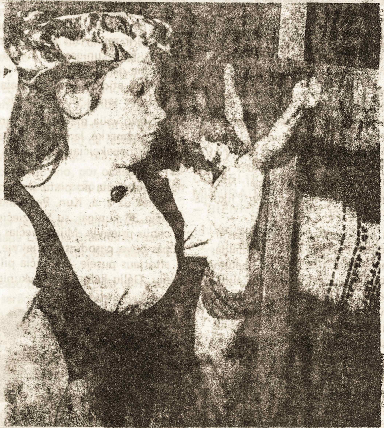
Lituanas arrajam flores durante o funeral de um compatriota morto

Tarptautinė socialistų partija iš Anglijos viešame pareiškime pasmerkė so-