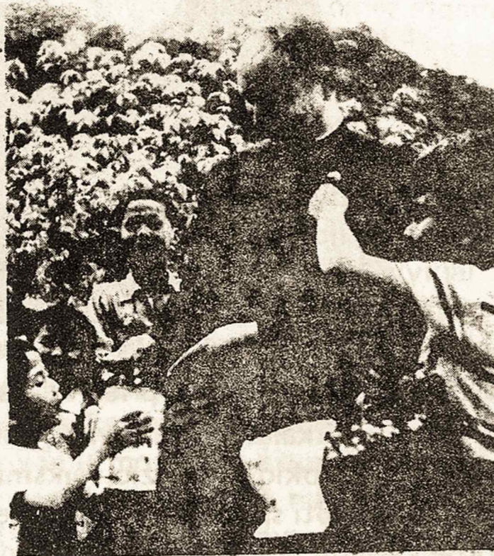
Dėkingumo gėlė mielam geradariui.