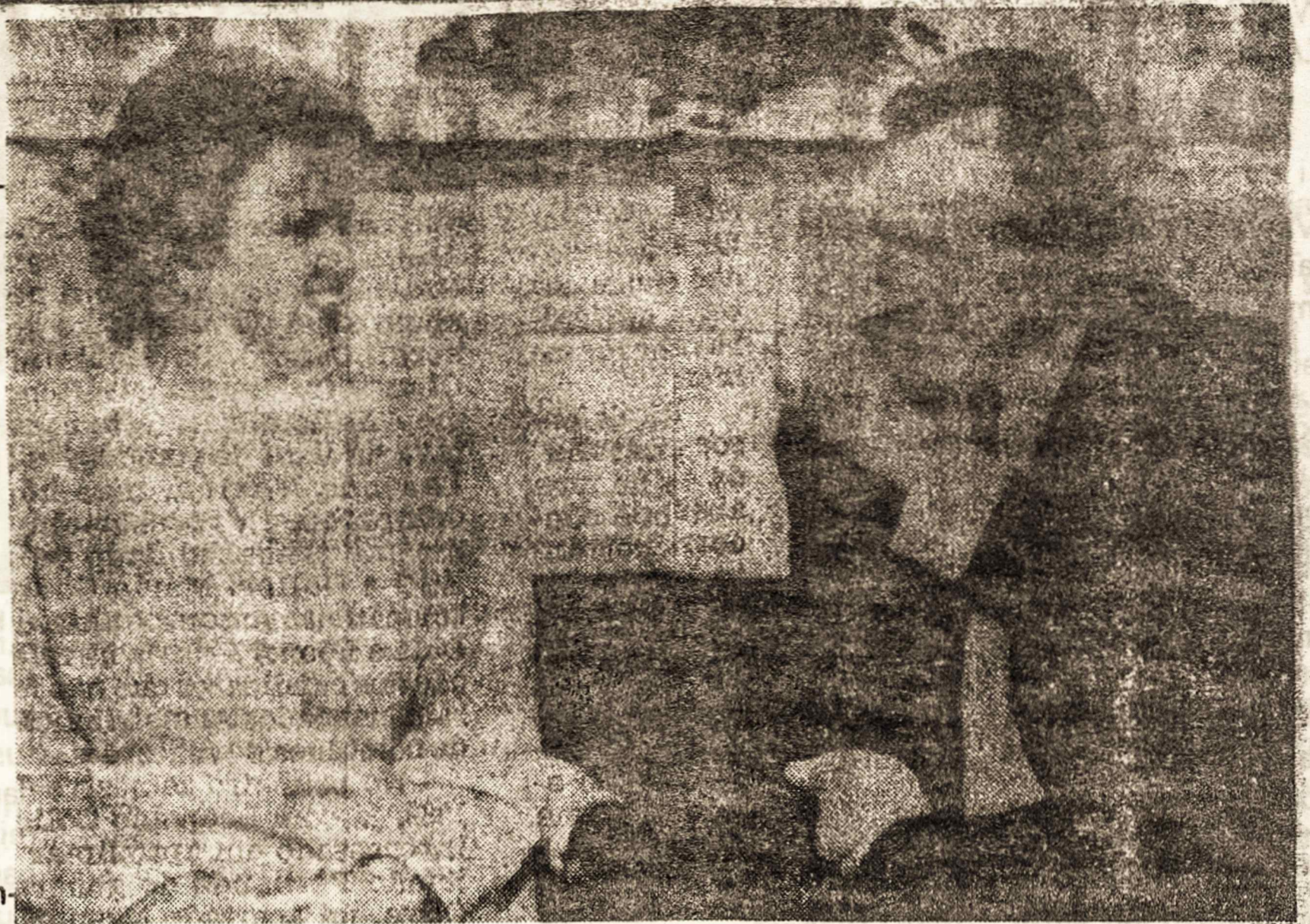
Bush'as ir Kazimiera: daug šypsenų ir komplimentų, bet ir įspėjimas – jūs per daug nesilaukite. Tai Estado de S. Paulo komentaras

rusų baltųjų imperialistų kalbos labai skyrėsi nuo darbų. Lygiai taip, kaip ir greitai juos nuvertusių raudonųjų imperialistų. Pvz. po Vasario revoliucijos Rusijoje, dar eidamas teisingumo ministro pareigas A.F. Kerenskis 1917.V.3 sakė: "Juk yra visiškai natūralūs ir elementarūs dalykai (niekas ir niekad negali gyventi ne savo namuose, kaip niekas ir niekad nesutiks atsisakyti savo namuose būti šeimininkai". Ir vis dėlto estų tautai, siekiančiai nepriklausomybės (kaip ir visoms kitoms Rusijos imperijoje vargujančioms tautoms), jis jokių būdu nesutiko leisti būti pilnu šeimininku savo namuose. Žurnale "Naujoji Romuva" (1939 m. nr. 4, 186 p.) skaitome: "Rusų revoliucijai 1917 m. įvykus. Rusijos vyriausybė leido šaukti estų tautos seimą su sąlyga, kad tas seimas nesiektų nepriklausomybės, bet pasitenkintų autonominiu susitvarkymu".