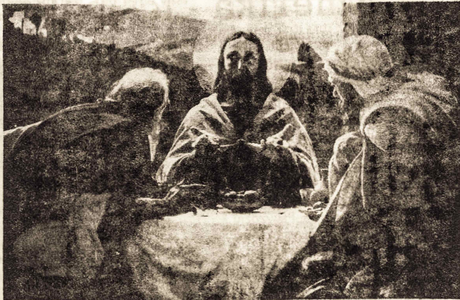
EMAUS: mokiniai atpažįsta Prisikėlusį Kristų per vakarienę per duonos laužymą

Didžiojo šeštadienio dieną sunkesnių darbų nebedirbdavo: trobos jau švarios, mėsa paruošta, velykinė atlikta... Taigi eidavo į pirtį, tačiau ne vakare, kaip paprastai, bet dienos metu. Čia iš pagrindų išprausdavo savo kūną, išvanodami jį karštomis beržinėmis vantomis, pakeisdavo skalbinius, užsidėdami švarutėlius lininius ir tai geriausias iš visų, kiek jų kas turėjo. Grįžę iš pirties, nebedirbdavo. Kai suskambėdavo prie bažnyčių pastatytieji būgnai, dalis namiškių eidavo į bažnyčią stacijoms ir dažnai pasilikdavo ten per naktį Kristaus prisikėlimui: likusieji namie, ypač moteriškosios, baigdavo virti, kepti velykinius valgius, dažydavo margučius (cibulių lukštai ar vantų labai buvo iš anksto paruošti). Tą dieną vaikai, grįždami iš bažnyčios, atnešdavo šventinto vandens, kuris būdavo pagarbiai padedamas ant velykinio stalo ir kempines su ugnimi. Šis ugnies šventinimas, be abejonės, yra labai senas lietuvių paprotys, užsilikęs iš senosios tikybos laikų. Yra manoma, kad ugnies garbinimo paprotys mūsų tautiečių tarpe buvęs toks stiprus, kad kunigai negalėję jo išrauti. Taigi bažnyčia jį, taip ir palikusi, tik palaimindama ugnį. Atneštoji šventinė ugnis buvo dedama į priekrosnio židinį, kad per visus metus rūmentų ir tuo skleistų namams šilimą paaimą.