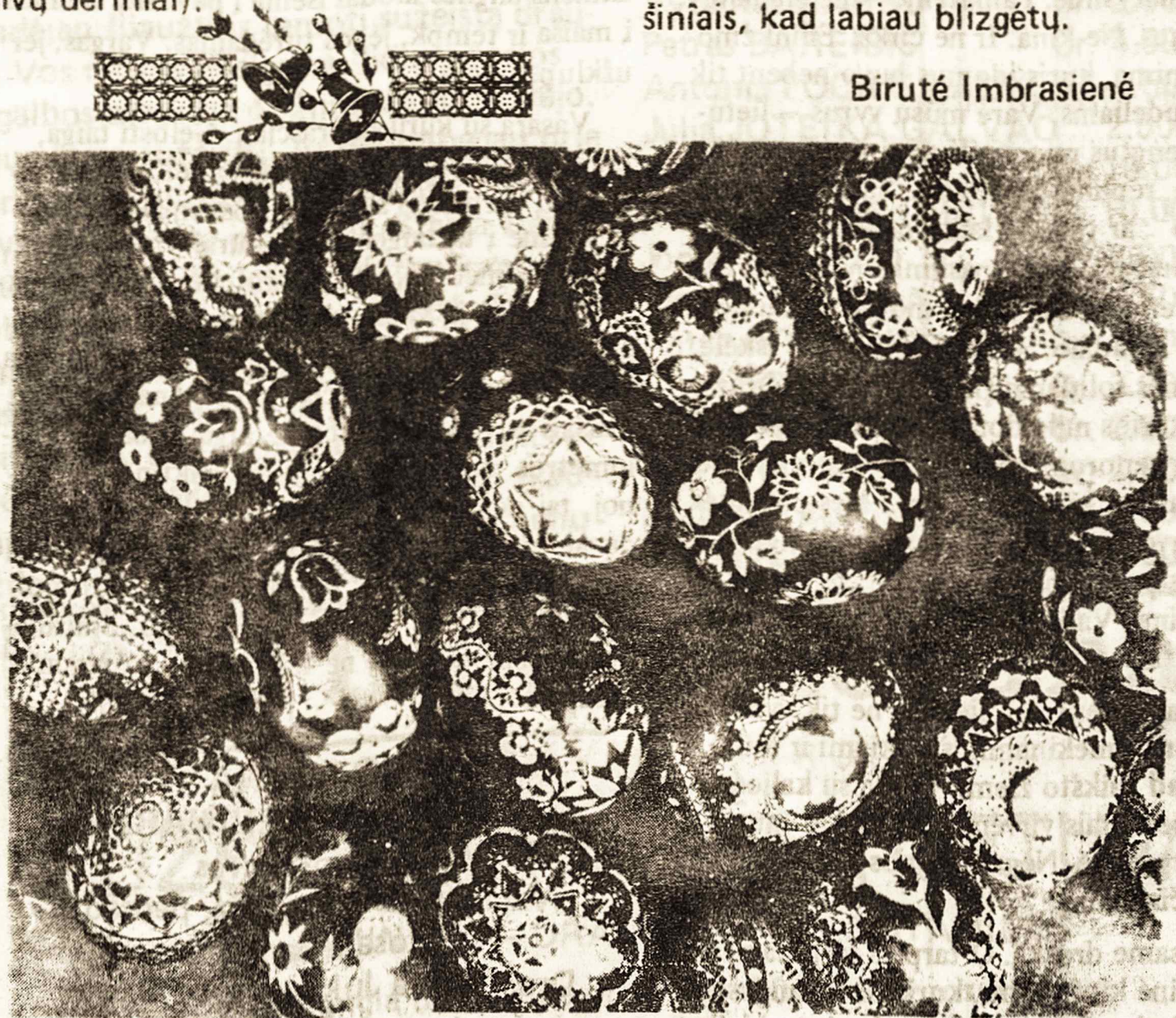
Klaros Virškuvienės skutinėti margučiai