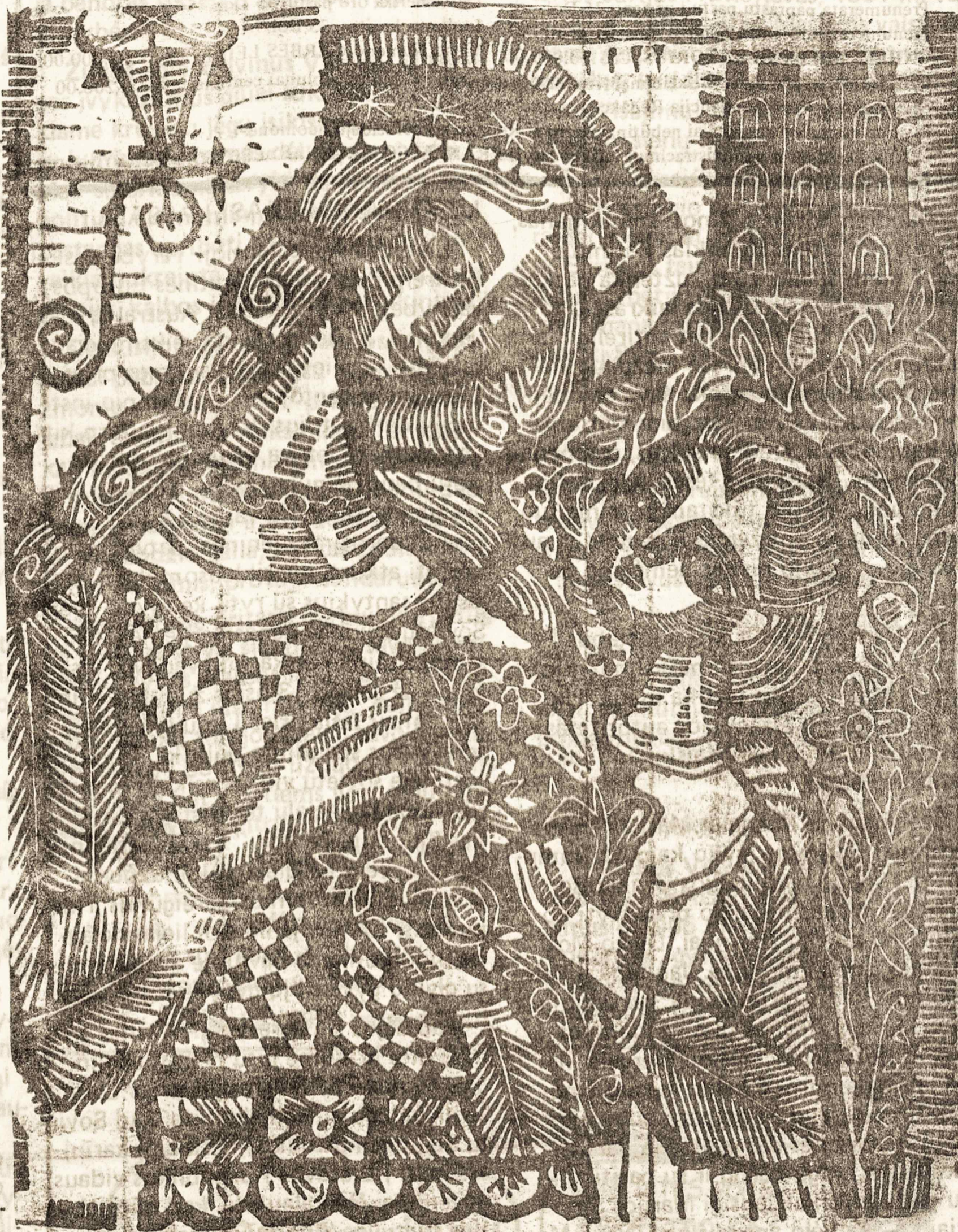
MARIJA – DIEVO IR MŪSŲ TAUTOS MOTINA

Dvidešimtas amžius teisingai gali didžiuliuoti savo nepaprastais išradimais ir įvykiais. Šiame amžiuje išrastas radijas, televizija, radaras, suskaldytas atomas, paskelbta reliatyvizmo teorija. Du pasauliniai karai sužlugdė daug Europos valstybių ir paskelbė jų santvarkas. Tačiau nuostabiausias šio amžiaus įvykis yra Dievo Motinos pasirodymai Fatimoj 1917 metų gegužės- spalio mėnesiais. Tie pasirodymai įvyko nuošalioje Portugalijos vietovėje, akmenuotoj ganykloj. Čia Dievo Motiną šešis kartus matė ir su ja kalbėjosi trys paprasti piemenėliai: Liucija – dešimties metų, Pranas – devynerių metų ir Jacinta – septynerių metų. Marija pasirodė šešis kartus kiekvieno mėnesio 13 dieną išskiriant rugpiūčio mėnesį, kai vaikai buvo areštuoti. Pasirodymų tikrumą patvirtino iš anksto pažadėtas nepaprastas įvykis, – saulės stebuklas, – kurį paskutinę pasirodymų dieną matė 70 tūkstančių žmonių. Pradžioje pasirodymam niekas netikėjo: nei vaikų tėvai, nei artimieji, nei dvasiškija. Apskrities viršininkas vaikus buvo net areštavęs ir grasinimais vertė atšaukti savo pasakojimus, kaip melagingus... Kiekvieną stebina didvyriškas vaikų regėtojų pasiaukojimas, jiems pasakytos paslapties išlaidymas ir laikysena tardymo metu. Neįmanoma įtarti, kad jie būtų dirbtinai parengti tokiam vaidinimui. Jie turėjo būti paveikti nežemiško reginio. Už ap-