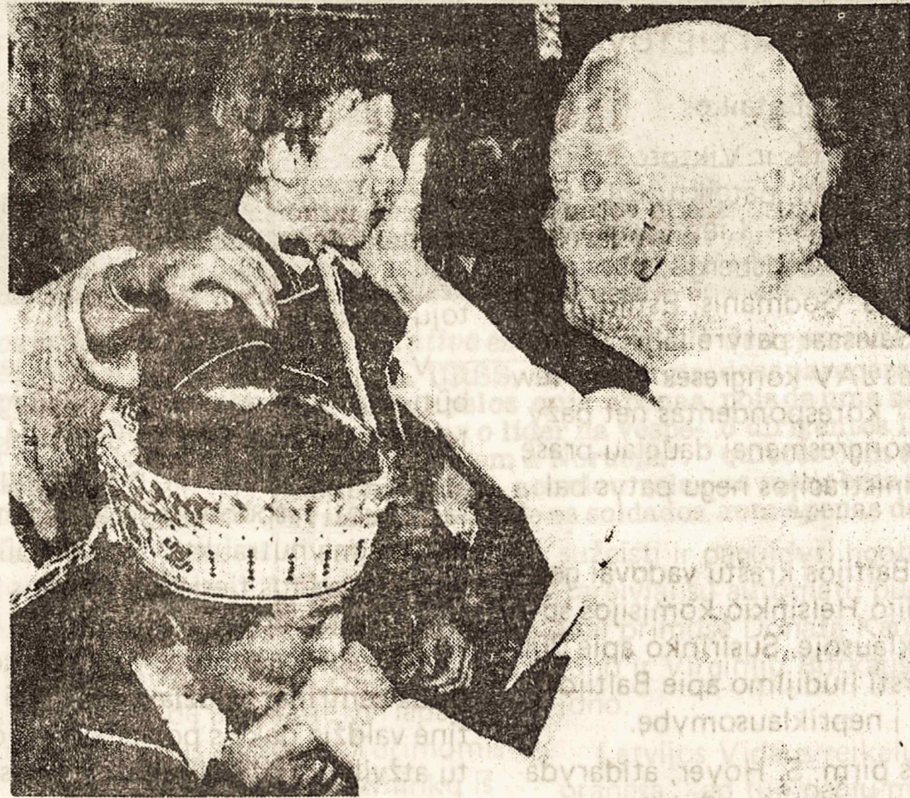
Papa abençoa lituanos em Lomza: apoio moral e espiritual

neses devem livrar-se dos resíduos do sistema anterior. E fez a defesa da propriedade privada, afirmando que "o homem tem o direito de possuir bens e o dever moral de produzi-los para outros".