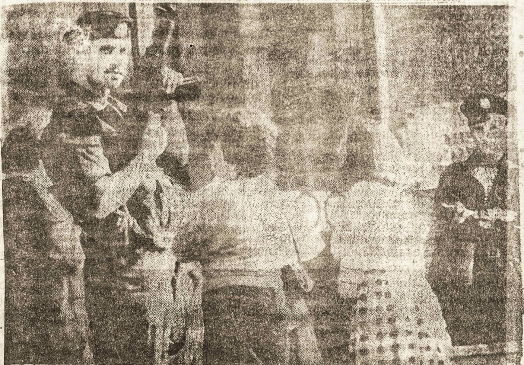
Tropas de Moscou na central telefônica da Lituânia: o objetivo era procurar armamento

Segundo Yeltsin, o acordo bilateral deverá “tirar do ponto morto” as negociações entre o Kremlin e a república báltica.