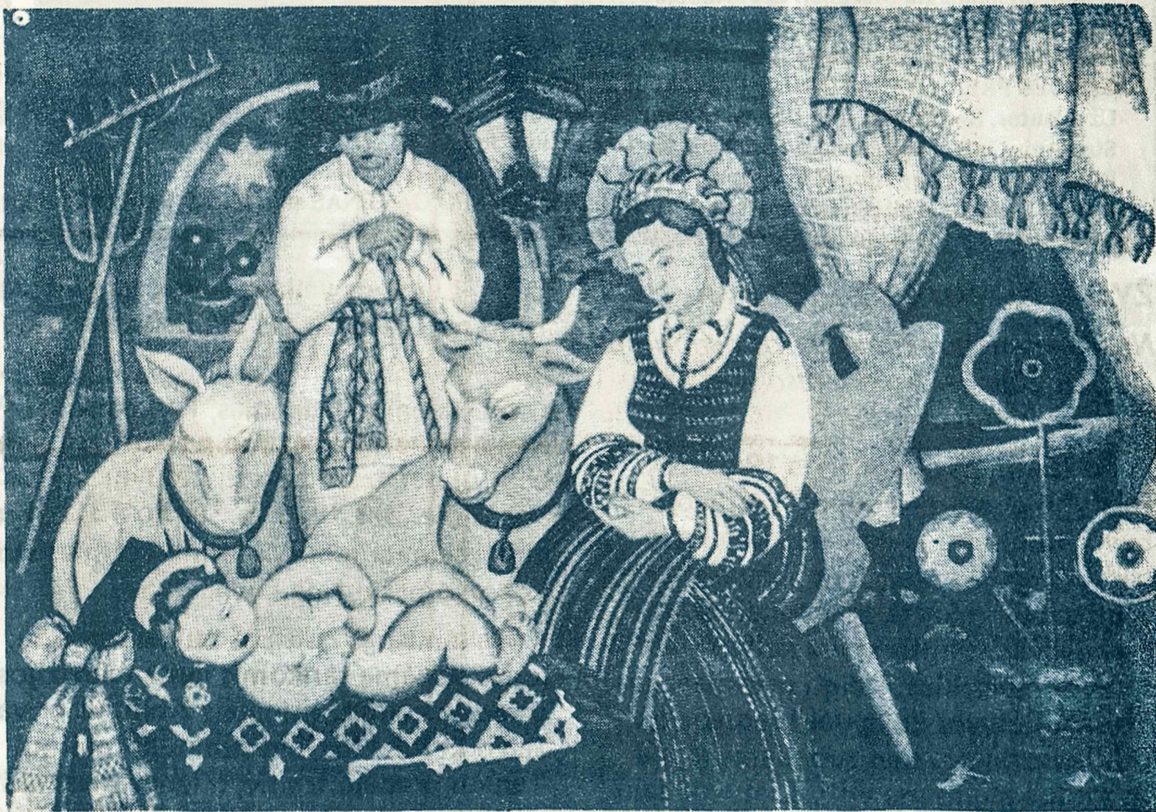
Dail. Irenos Pacevičiūtės sukurtas paveikslas lietuviškame stiliuje "Užgimimas"

Daug laimingų, džiugių ir kartais skaudžių momentų išgyvenome paskutiniaisiais metais: Vingio parko stebuklą, Baltijos kelią, kovo 11-tąją, sausio 13-tosios naktį bei rugpiūčio 18-21-os dienas; Lietuvos trispalvės iškėlimą Jungtinių Tautų vėliavų parke rugsėjo 17-tąją. Už šias ir kitas akimirkas dėkosime Tautų Tėvui ir į mūsų žmonių gyvenimą įsijungusiam, mūsų likimu besidalijančiam Jo Sūnui Jėzui Kristui, kuris prieš 2000 metų savo pirmuoju atėjimu