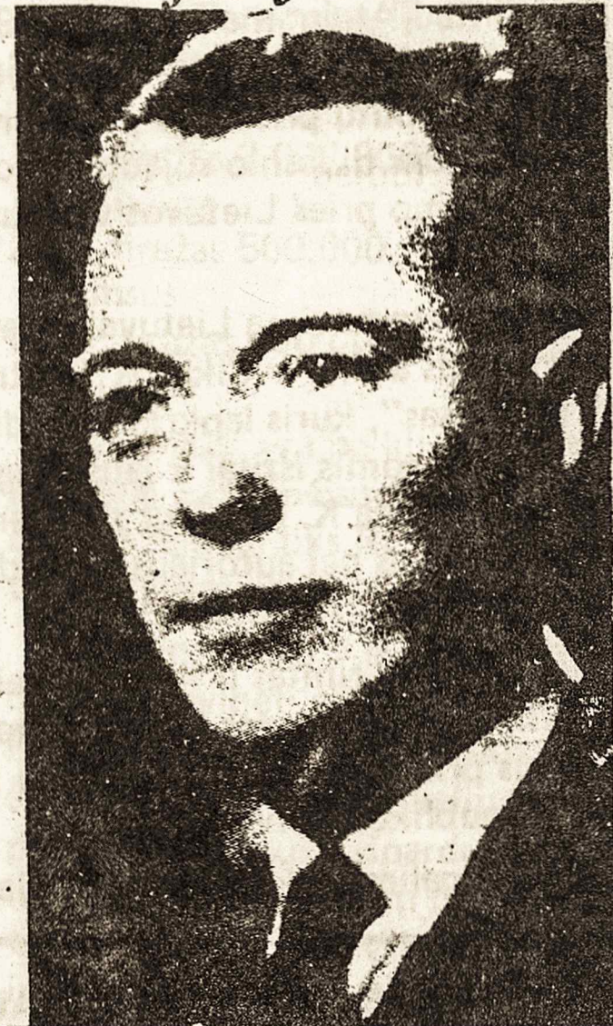
ANTANAS ŠABANIAUSKAS garsiausias Lietuvos pramoginės muzikos artistas naujai įgrotojo jo gražiausių interpretacijų juostelė. "MŪSŲ LIETUVA".