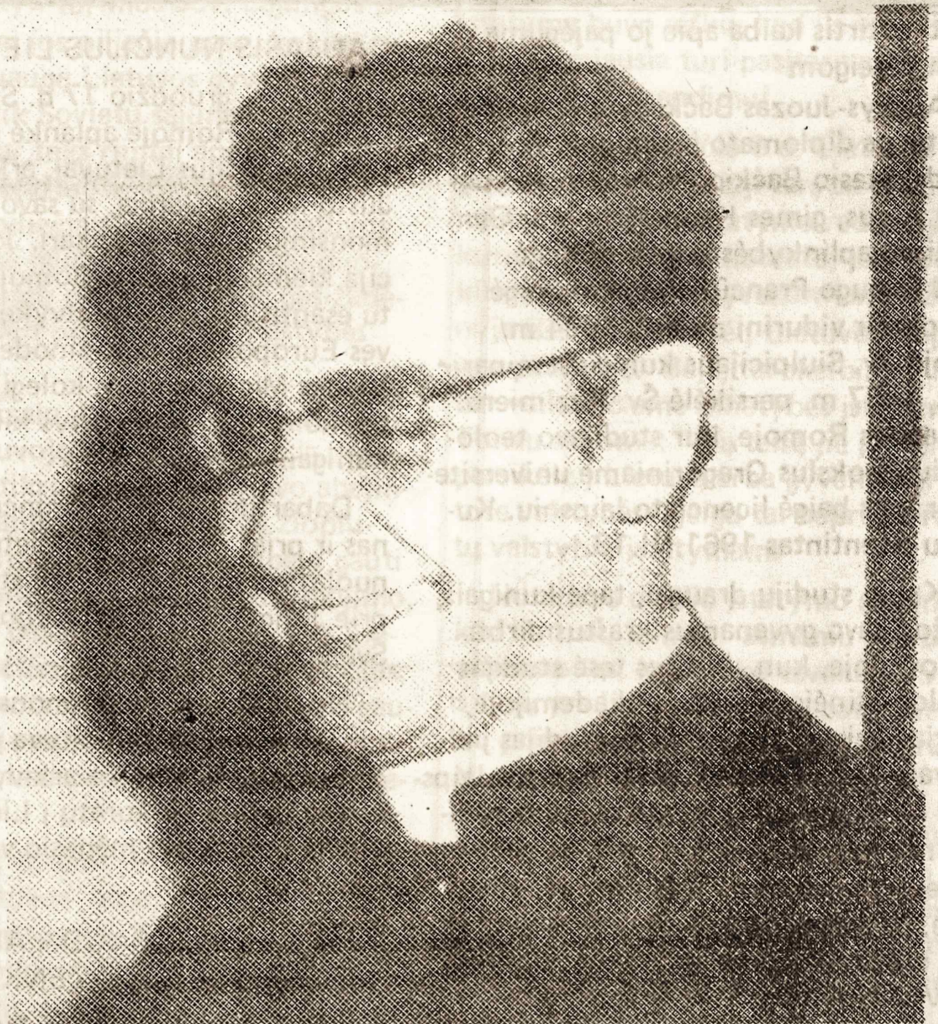
Jo Ekscelencija arkivyskupas AUDRYS BAČKIS, paskirtas Vilniaus arkivyskupu metropolitu

Šv. Tėvas Jonas-Paulius II paskyrė Vilniaus arkivyskupu Audrį Bačkį, Vatikano pronuncijų Olandijai, vietoje mirusio a.a. Julijono Steponavičiaus • Vilniaus arkivyskupija atskirta nuo Lenkijos hierarchinės santvarkos ir prijungta prie Lietuvos tikibinės provincijos