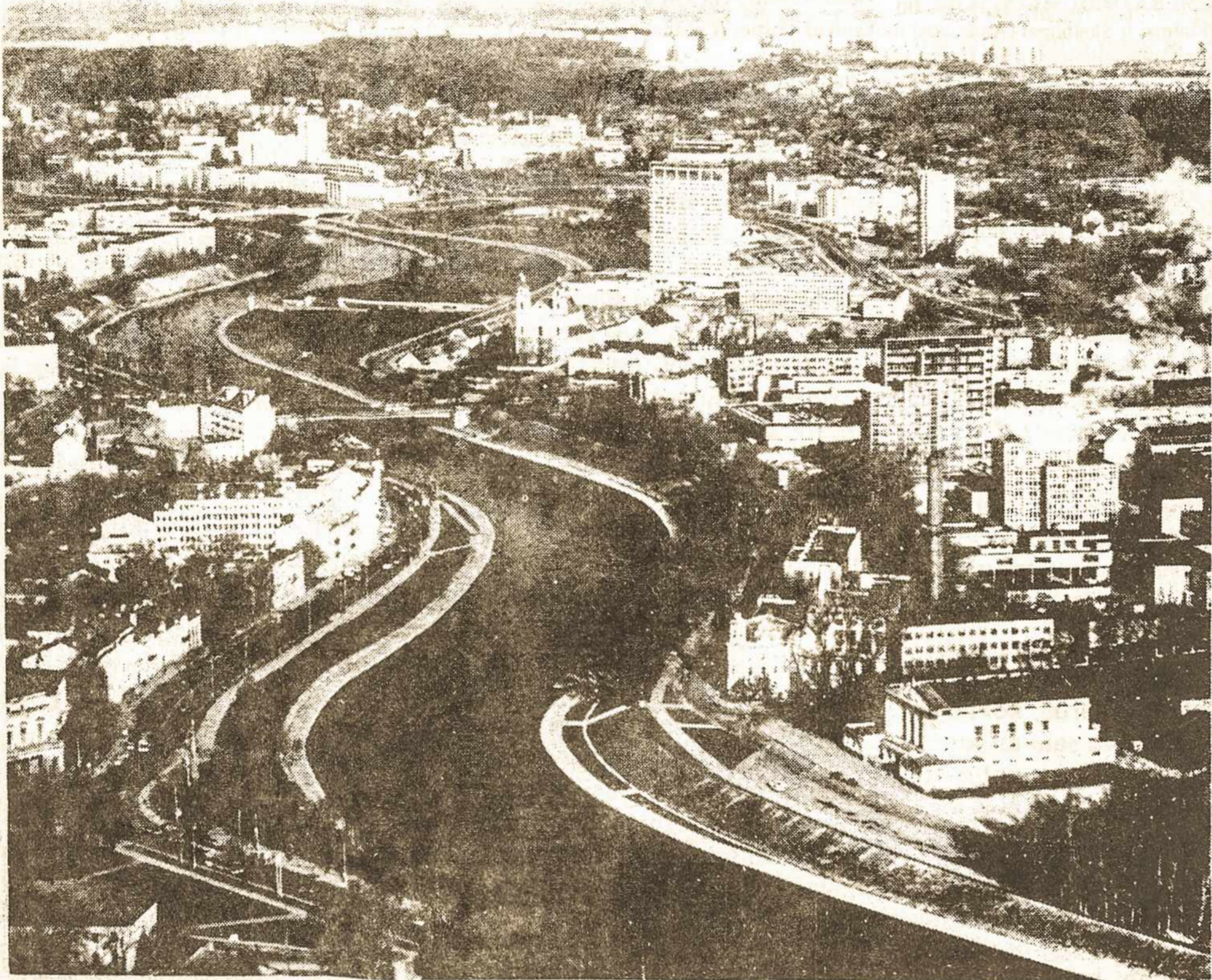
Vilnius iš paukščio skrydžio