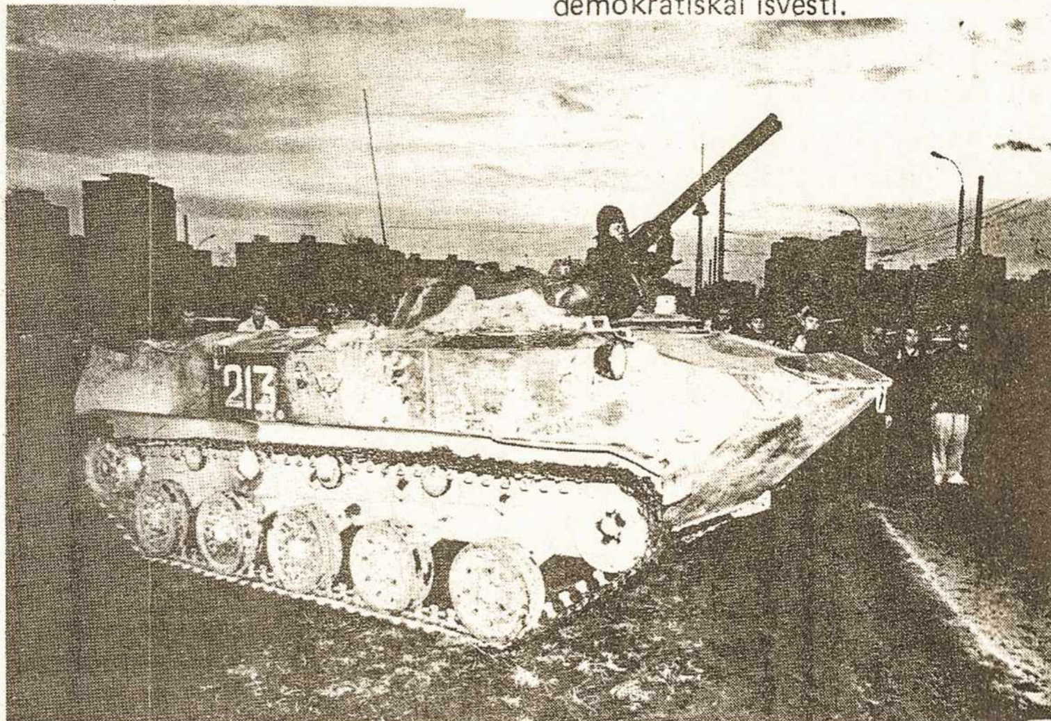
Sov. armijos tankas puola Spaudos rūmus 1991 sausio 11 d. Vilniuje.