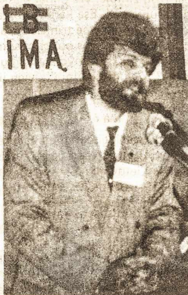
Lietuvos kultūros ir švietimo ministeris DARIUS KUOLYS kalba PLB seime Lemonte

Klausai jų, bendrauji su jais ir jauti slogutį gerklėje, apmaudą širdyje ir nejuociom susigūži iš gėdos, iš gailėsčio, iš nejaukumo — kokie mes išlepe, nesuprantantys, reikalaujantys — neįvertinam savo perpildytų gyvenimų ir turimų sąlygų ir drįstame dejuoti. Ir tokia daugybė — nieko nedarom (net apie 50 leidusių save išrinkti atstovų, seime nepasirodė), bet kritikuojam ir matuojam kitų darbus, pasiekimus ir sąžines. O mūsų broliams iš anapus ir malonus šypsnyš, žodis, dėmesys atrodė karališkas. Padėkoms nebuvo galo. Ir nejauku, kai pretenduojam į dvasingumo, veiklos pavyzdžius, net į prezidento postus, o toj savo prabangoje realybėje darbai — labai smulkučiai.