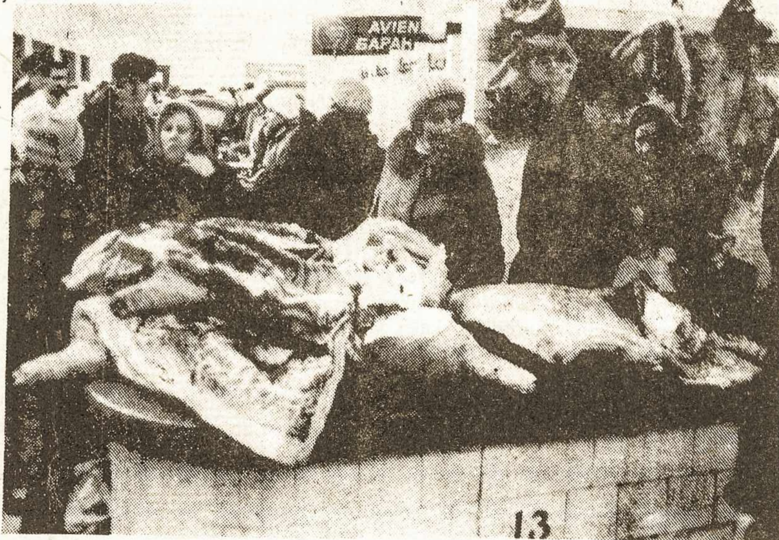
Vilniaus turguje

Lietuva pirmoji žengė ekonominių ir politinių permainų keliu, tad dabar aukščiausiai patiria permainų laikmečio sunkumus bei nuostolius. Akivaizdu, jog šiandien bandoma sustabdyti reformas Lietuvoje. Kyla pavojus, kad kiek vėliau tai gali nutikti ir Rusijoje. Todėl ypač šiuo sudėtingu metu demokratinio pasaulio dėmesys šio regiono problemoms neturėtų silpnėti.