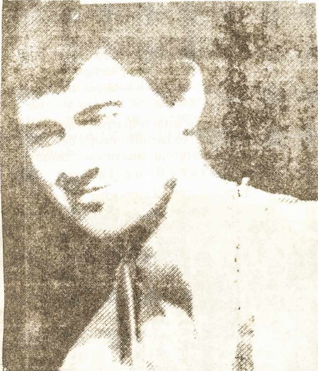
XXV OLIMPIADOS ČEMPIONAS ROMAS UBARTAS

XXV OLIMPIADOJE LIETUVOS SPORTININKAI LAIMĖJO AUKSO IR BRONZOS MEDALIUS! SVEIKINAME LIETUVOS SPORTININKUS! Lengvaatletas ROMAS UBARTAS laimėjo pirmą vietą disko metime, o Lietuvos krepšininkai - trečią vietą!