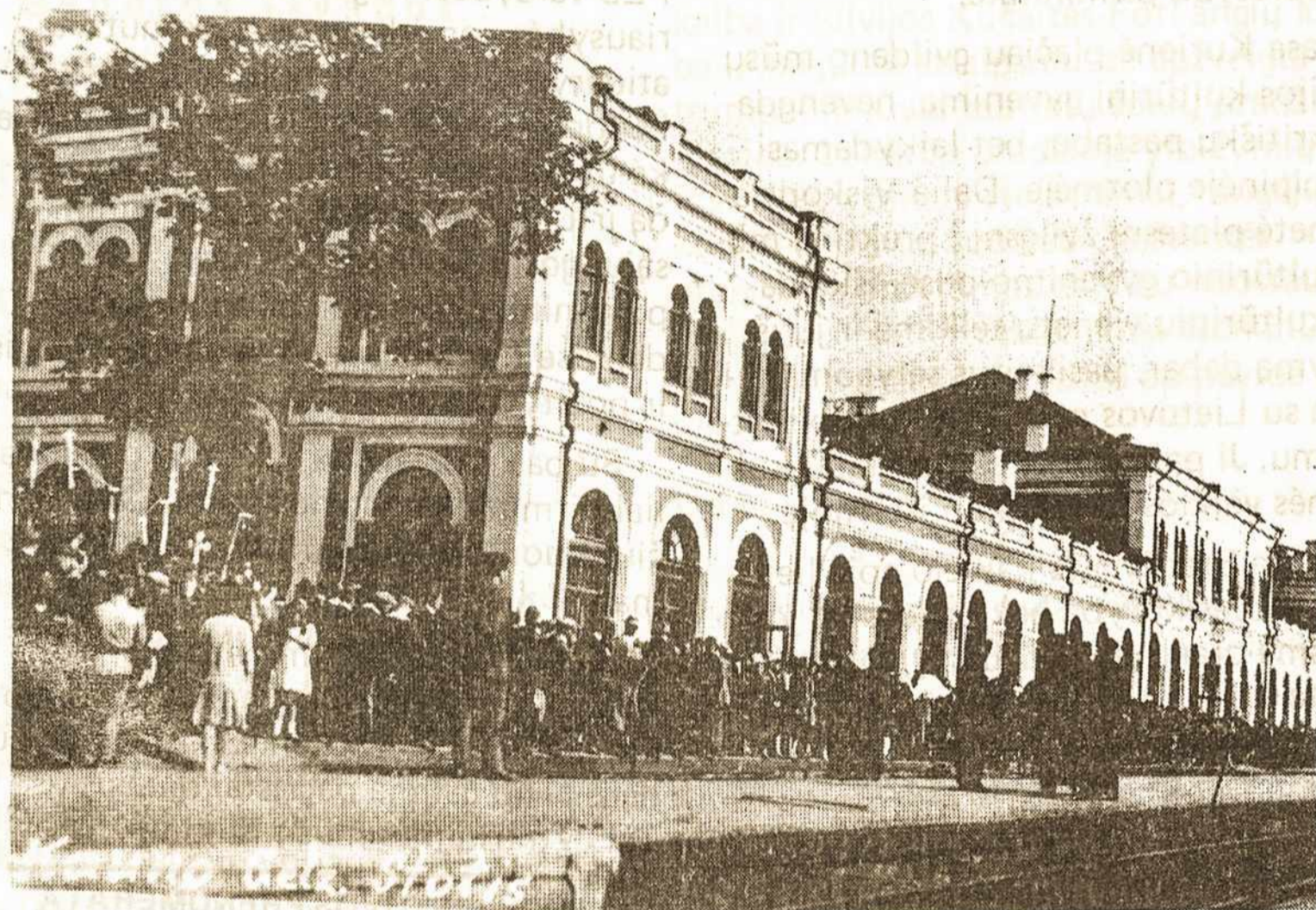
Kauno geležinkelio stotis Nepriklausomybės metais.

CIRURGIĀ DENTISTA CIRANÇAS E ADULTOS PREVENÇÃO E TRATAMENTOS ODONTOLOGICO