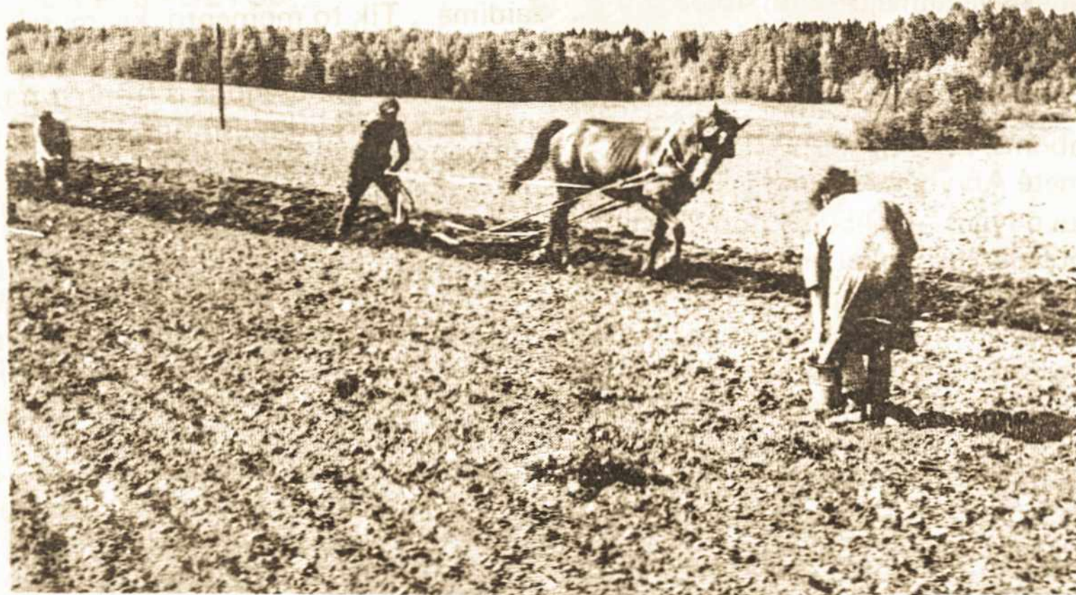
Žemaitkiemys, Ukmergės rajone, žrionės sodina bulves. 1992 m. pavasaris.

CIRURGIĀ DENTISTA CIRANÇAS E ADULTOS PREVENÇÃO E TRATAMENTOS ODONTOLOGICO