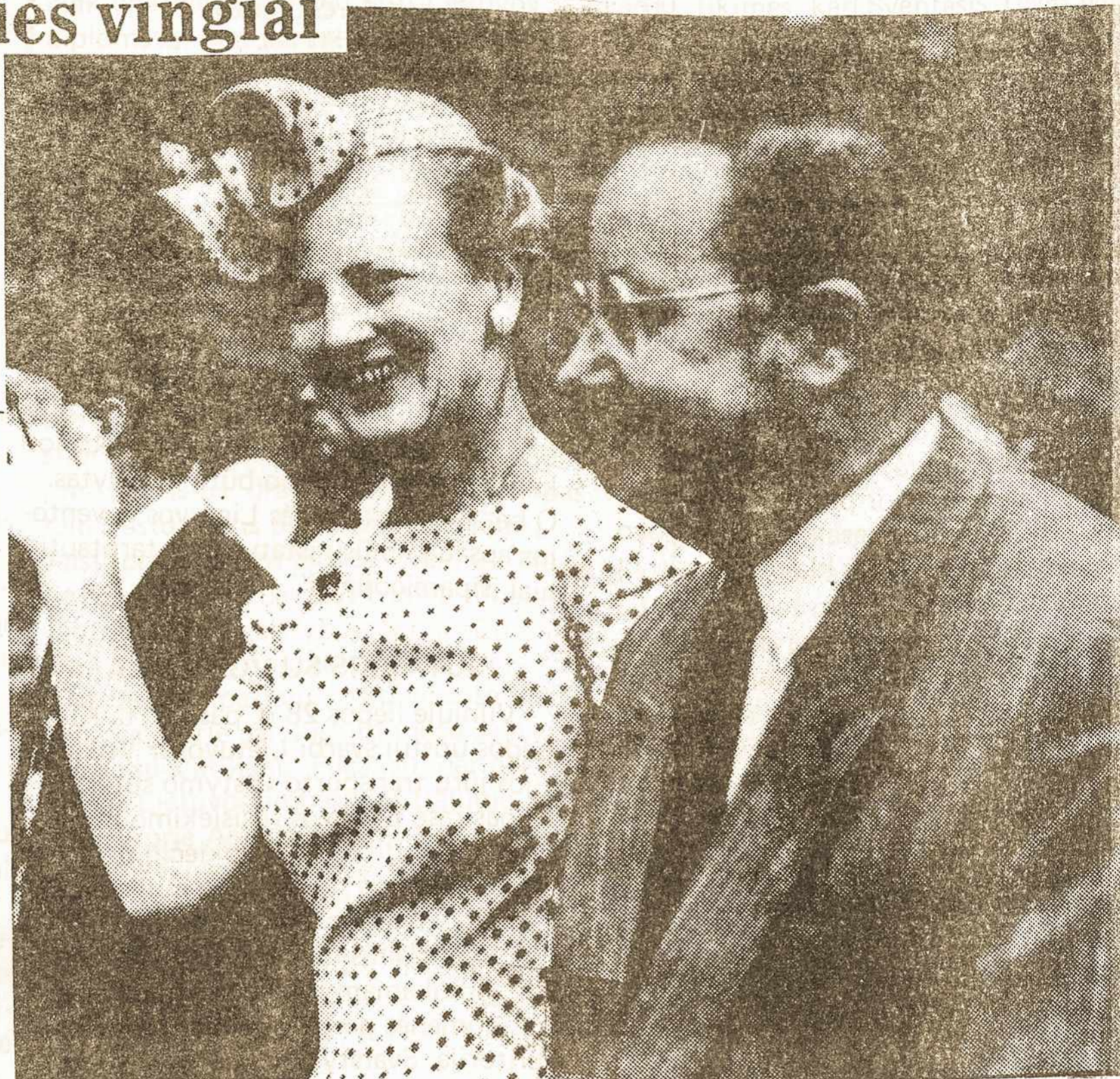
Danijos karalienė MARGARITA II Vilniuje su Lietuvos aukščiausiosios tarybos pirmininku VYTAUTU LANDSBERGIU.