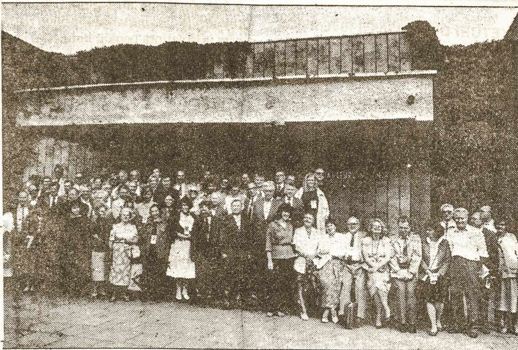
BIRŠTONAS – Lietuva: dalis konferencijos "LIETUVA IR JOS IŠEIVIJA" dalyviai prie Kultūros centro auditorijos