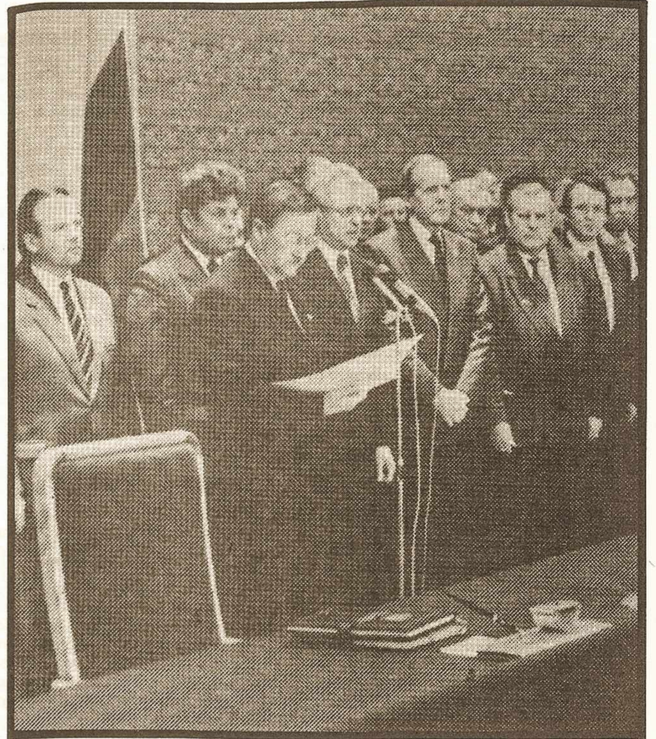
Presidente Lansbergis na presença do corpo diplomático e ministério anuncia a nova Constituição da Lituânia.