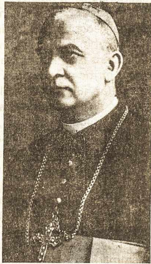
Palaimintasis Jurgis Matulaitis

Arkivysk. Matulaičiui ką tik mirus 1927 m. kun. Tumas Vaižgantas jau tada išreiškė gaugelio gilų įsitikinimą: "Ar tik žmonių širdys nebus numaniosios, kad vyskupas Jurgis galės būti ir danguje vargšų žmonelių užtarėjas? Iki 1939 m. priskaityta virš 200 pagijimų rišamų su Matulaičio užtarimu. Tarp 1959 ir 1965 m. už Lietuvosnribų buvo gauta 791 padėka už išklaustas maldas per Matulaičio užtarimą. Tikinčiųjų tarpe Lietuvoje ir svetur, pasitikėjimas ark. Matulaičio užtarimo galia vis didėja. Dabar sulaukę jo paskelbimo palaimintuoju, galima ir viešai kreiptis su savo prašymais. Žinome ir pasitikime, kad jis gali ir nori mums padėti.